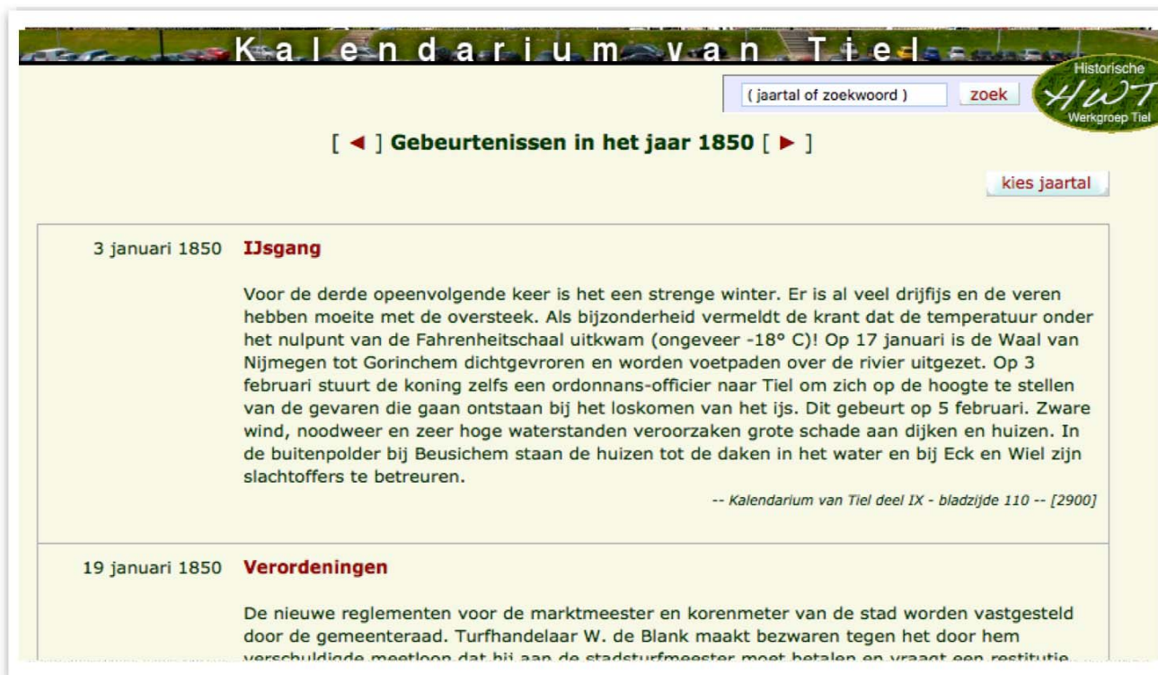
Een fragment van het digitale Kalendarium van Tiel

Ook het digitaliseren van het onvolprezen “Kalendarium van Tiel” nadert zijn afronding. Bij deze laatste twee projecten wordt de werkgroep bijgestaan door de tomeloze inzet en vakmanschap van webmaster Dick Buijs.