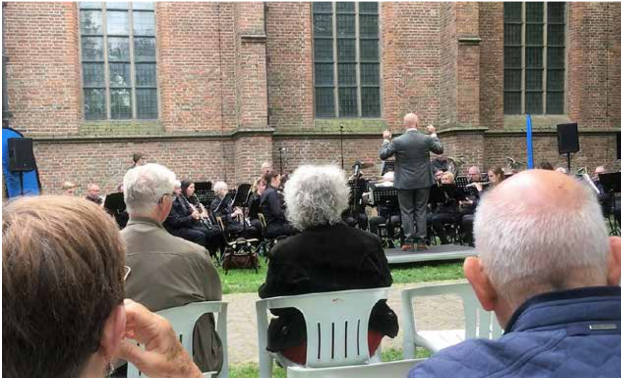
♣ Concert van het Tielse carillon met KTVM, 7 mei 2022