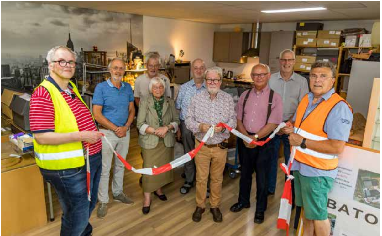
📍 Opening van de nieuwe werkruimte van BATO op 18 april 2022