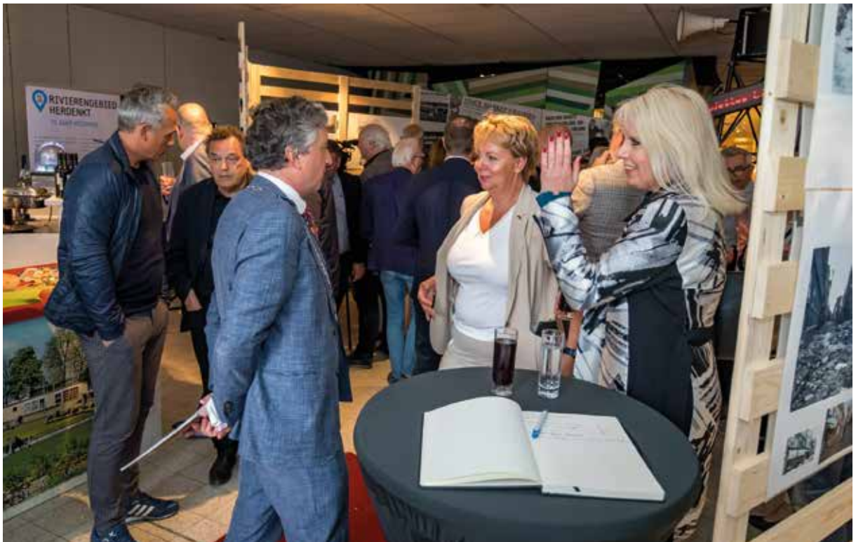
📍 Opening van de tentoonstelling 'Alles Kwijt' op 3 mei 2022