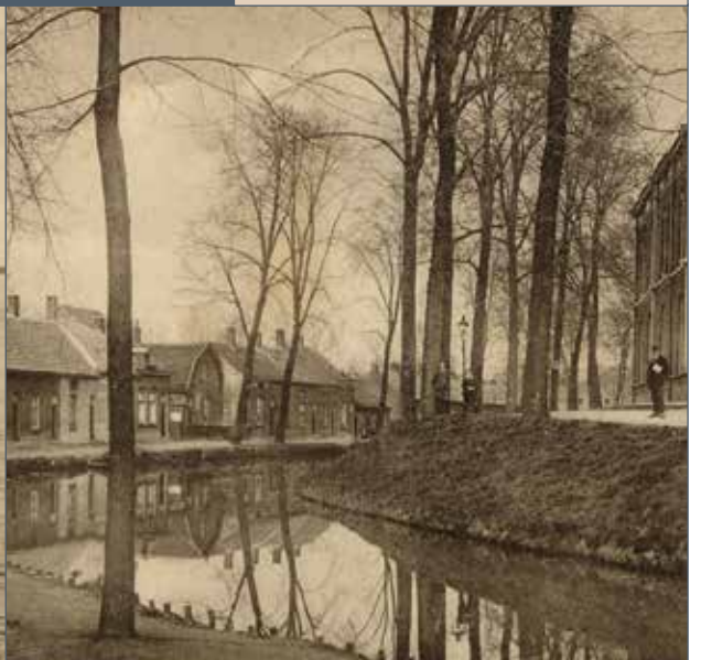
St. Walburg Binnen- en Buitensingel