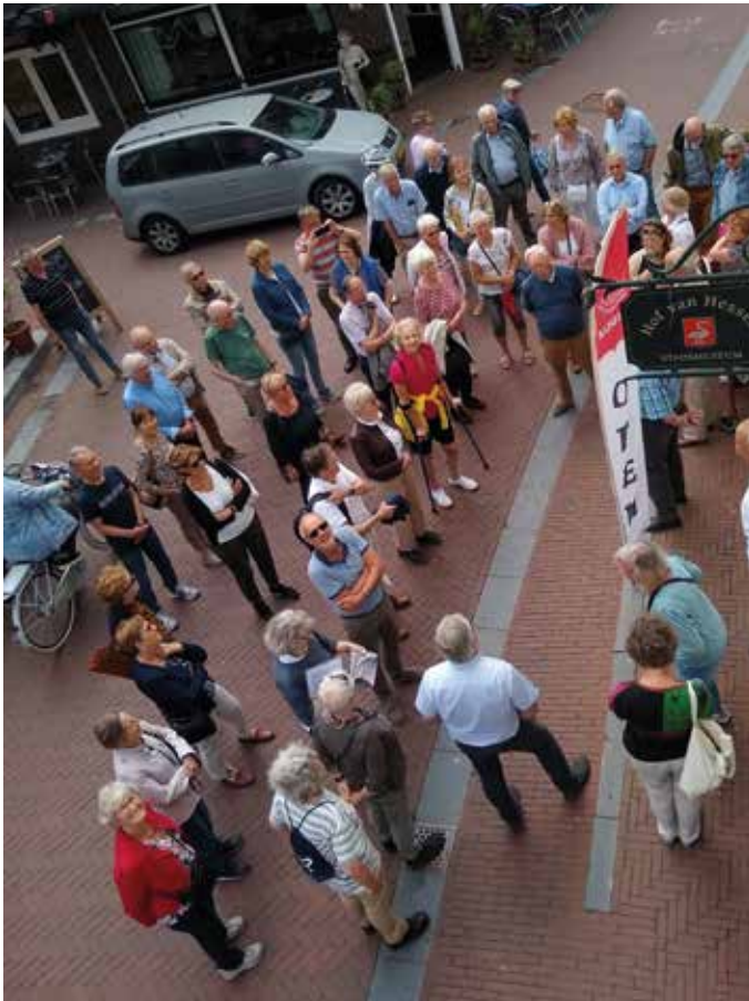
◀ De ontvangst van de Oudheidkamerleden in Huissen tijdens de grote excursie op 4 juni 2022