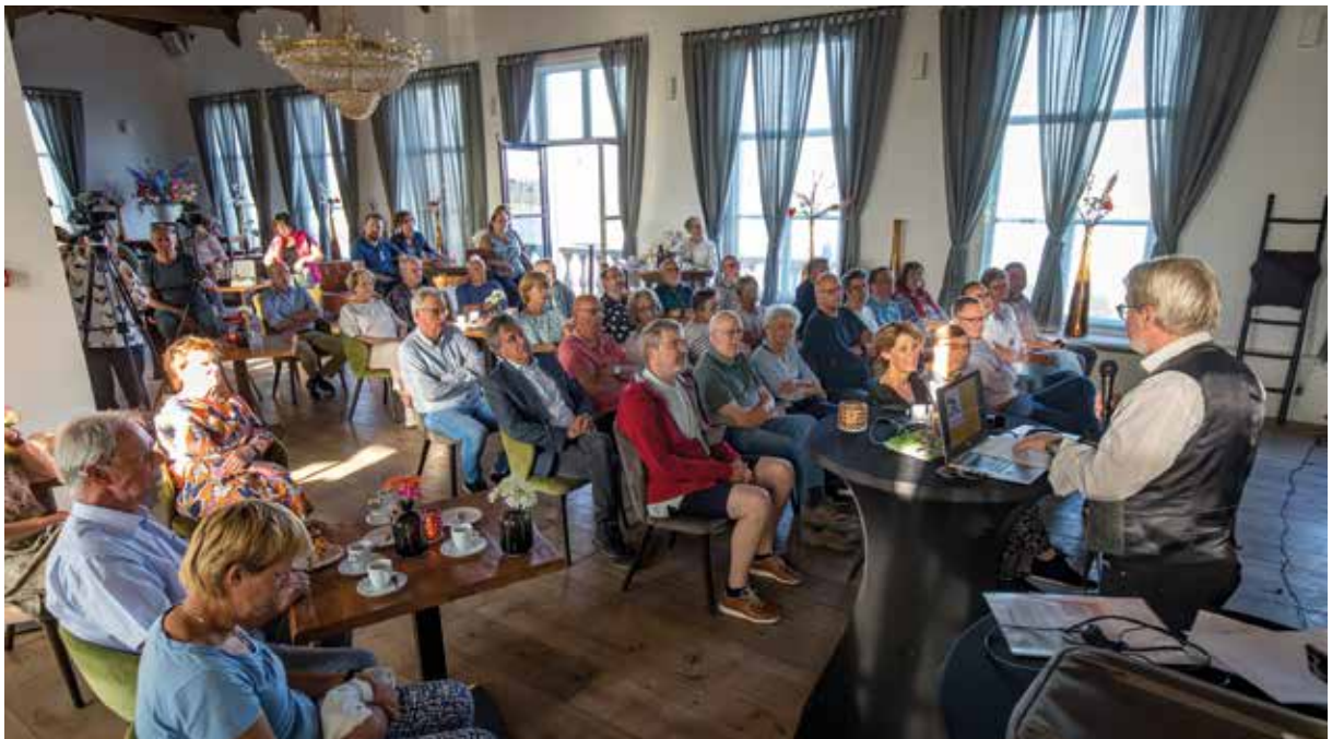
De bijeenkomst voor nieuwe leden van de Oudheidkamer op 13 mei 2022

Die vond plaats op 13 mei in de bovenzaal van Bellevue.