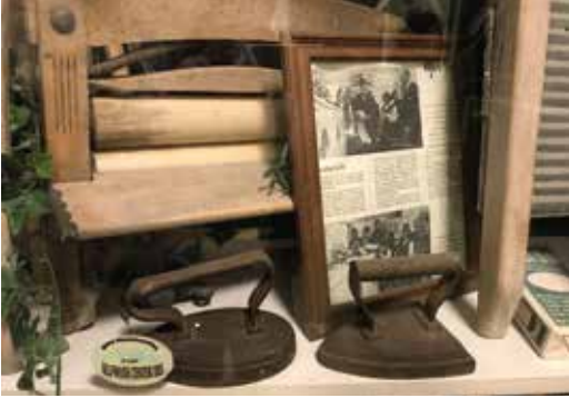
Nostalgie hoekje in de zaak

stond er een strijkmachine. Ik ging zelf de boer op om wasgoed op te halen, veelal bij restaurants, zoals De Tol in Meteren en het Kompas en De Batouwe in Tricht. De periode 1992-2012 was een goede tijd. Ik kocht een tweede strijkmachine, die 70 kilo per uur aankon. We pakten alles aan, ook was met rookschade. Daarnaast verhuurden we partytenten". De klanten voor het wasgoed zaten vooral in Maas en Waal tot aan Den Bosch toe en de meesten kreeg Septer via mond tot mond reclame. "Maar je moest ook keihard kunnen werken. Via de Twee Linden in Beneden Leeuwen kreeg ik de vraag van een cateraar of ik, als ik het linnen 's morgens om 7 uur ophaalde, kon garanderen dat het om 11.30 uur terug zou zijn. En dat dan gedurende vier dagen per week. Nou dat kon ik wel. Tussen het wasgoed stopte ik mijn kaartje. Toen werd ik gebeld door Van Gruythuizen uit Heesch voor wasgoed. Ik ging er met m'n Suzuki busje heen, maar er stond zo veel dat ik het niet mee kon nemen. Gelukkig bood broer Wout uitkomst, want bij hem kon ik een grotere bus huren. En zo rolde het balletje verder."