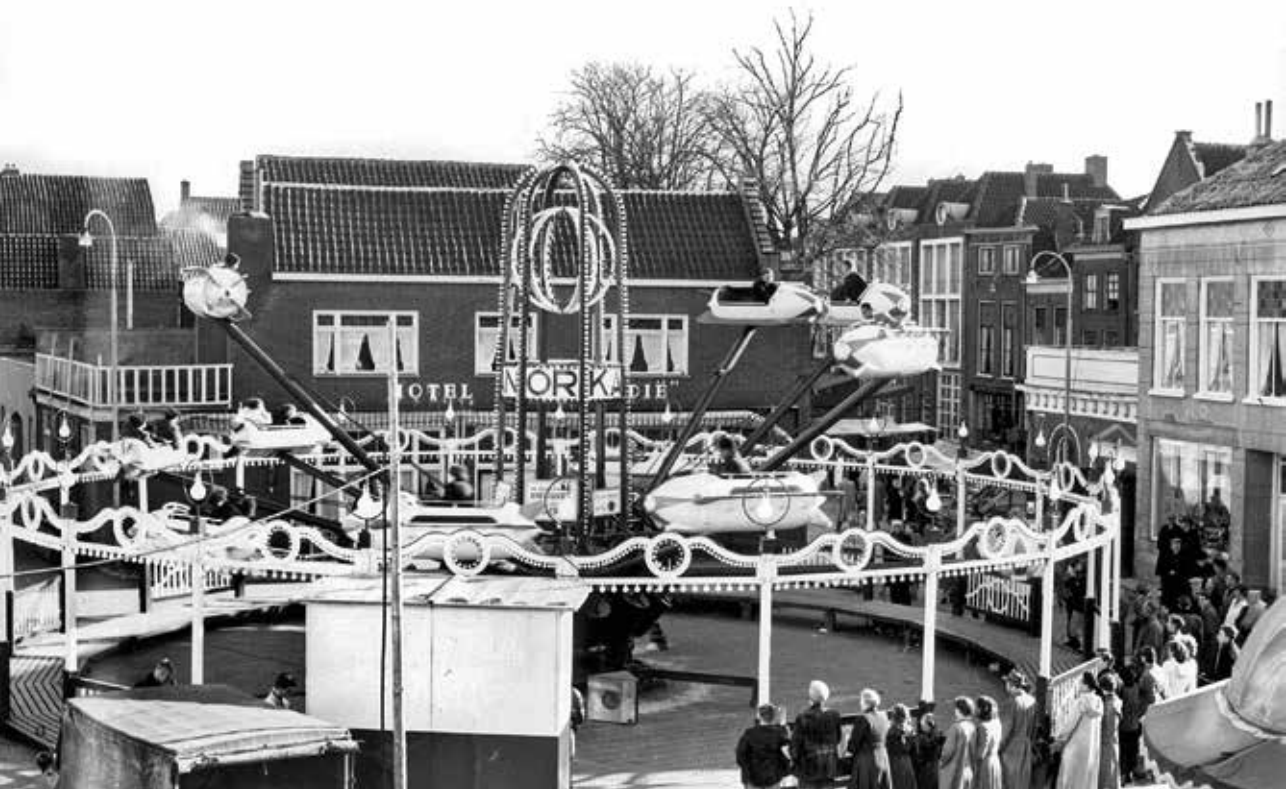
Kermis op de Varkensmarkt in Tiel, 1954