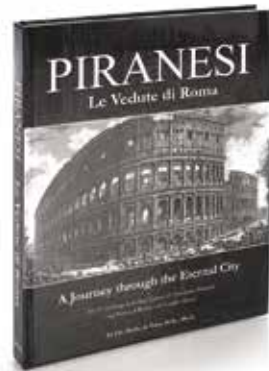
Piranesi - le Vedute di Roma