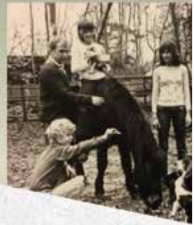
voor een Huis en Tuin.