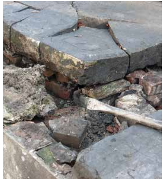
De ontmanteling van de zerk, najaar 2019.

Beide in de jaren dertig van de vorige eeuw nog hele zerken zijn de afgelopen decennia uiteen gevallen in tientallen brokstukken. Een uit ca. 1938 daterende foto toont twee gave zerken maar het vermoeden bestaat dat men bij reparatiewerkzaamheden na de oorlog, waarschijnlijk in de jaren vijftig toen weer bijzettingen plaatsvonden, onzorgvuldig te werk is gegaan bij het leggen van een goed op de onderkant van de zerken aansluitend 'bed'. De onderkant van de beide zerken is verre van vlak en dat betekent dat er een 'bed met een oppervlak op maat' moest worden toegepast. Dat is, door het gebruik van grover puin in plaats van bijvoorbeeld zand, indertijd niet gebeurd. Daardoor was er sprake van een soort puntbelasting die leidde tot het breken van de zerken op deze niet op de onderkant van de zerken aansluitende punten en richels.