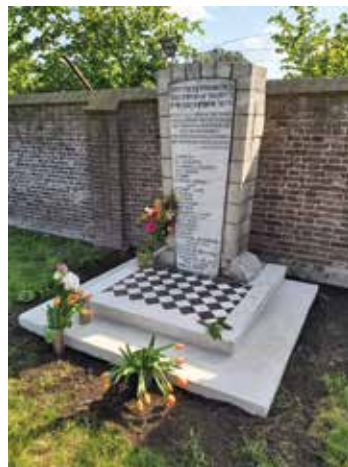
4 mei 2020.