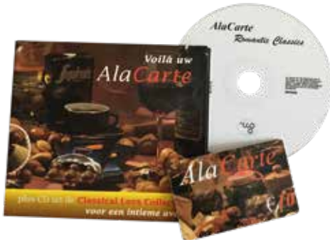
AlaCarte cadeaukaart en CD

AlaCarte was een soort cadeaukaart, waarmee je bij alle aangesloten delicatessenwinkels een pakket kon ophalen. Een goed idee, alleen lukte het niet om voldoende winkels aangesloten te krijgen.