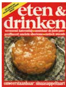
Tijdschrift Eten & Drinken

De sterke kant was de 'selectieve reclame'. Hij zocht samen met de kinderen in het telefoonboek de adressen van personen die dr, ir of mr voor hun naam hadden staan of die dokter of tandarts waren. Deze kregen het blad, als zijn potentiële klanten, gratis toegezonden.