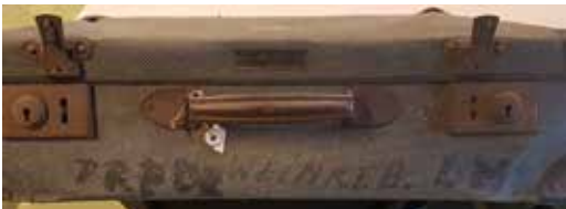
Bovenaanzicht koffer

De onaanzienlijke en lege koffer (het is niet bekend of er door Rudy iets in aangetroffen was), heeft duidelijk door de tijd geleden. De van een klein ruitjespatroon voorziene geperst papieren koffer, met op de hoeken lederen verstevigingen, is ingezakt. Bij het handvat is met een kwast de volgende tekst geschreven: 'PRF. DR. WEINREB. AMST.' Op het deksel zijn resten van opgeplakte etiketten te zien. Een is nog goed leesbaar. Het is een reisetiket van de 'Koninklijke