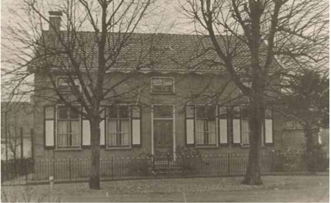
De bakkerij in Kapel-Avezaath