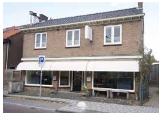
De Miele wasautomatiek aan de Hoveniersweg