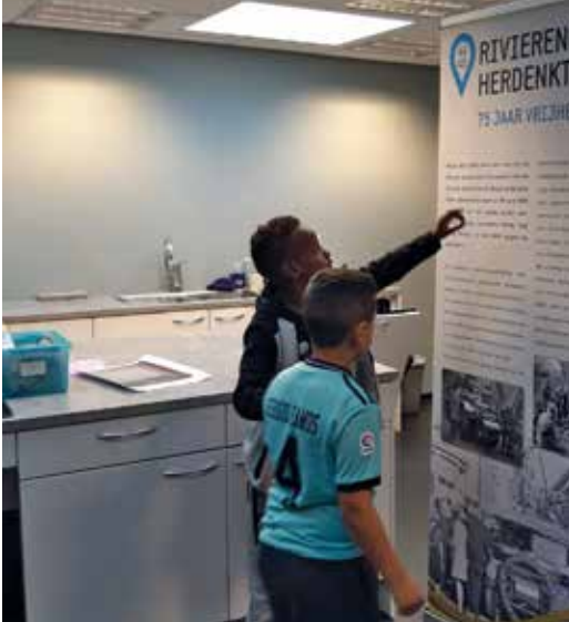
Projectles op de Mauritschool, november 2019