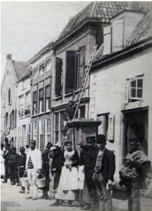
De Ambtmanstraat in 1890. Geheel rechts het oude pakhuis

Het schijnt een ongeschreven wetmatigheid te zijn: een oud gebouw dat moet wijken voor nieuwbouw dient anderhalf tot tweemaal zo hoog terug te komen in het straatbeeld. De ene keer pakt het goed uit de andere keer niet. In een vorige Kroniek schreef ik over het karakteristieke pand in de bouwtrant van de Amsterdamse School op de hoek van de Voorstad en de Oliemolenwal. 1 Het staat al jaren te verloederen. In een brief aan de gemeente Tiel zetten Waardevol Tiel, de vereniging Oudheidkamer voor Tiel, Stadsherstel en de Bond Heemschut zich in voor behoud. Op 19 mei vond een gesprek plaats tussen projectontwikkelaar Witte,