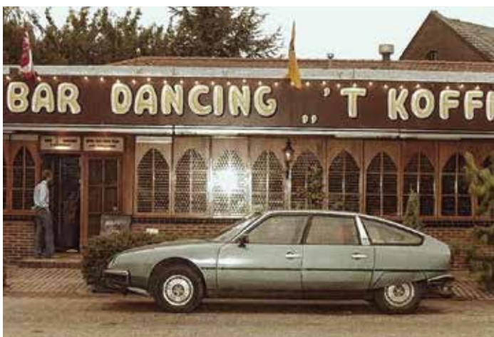
Het Stations Koffiehuis aan de Stationsweg in Tiel

Hiermee hoop ik u een klein inzicht te hebben gegeven in wat zich zo voordeed in een plattelandsdorp halverwege de twintigste eeuw. Een dorp dat toen nog hoofdzakelijk een boerenkarakter had, hoewel er soms al veranderingen merkbaar waren. Een tijd die je je nu nauwelijks meer kunt voorstellen.