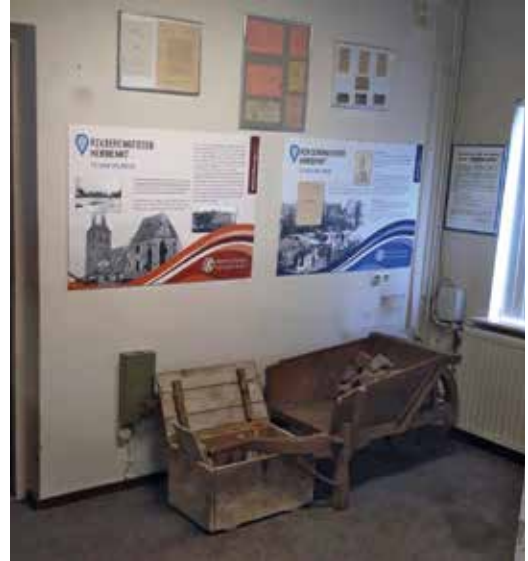
Een impressie in de expositie in Opheusden

Begin 2020 werd duidelijk, dat er een mooie ruimte beschikbaar was om in Opheusden ook een tijdelijke expositieruimte in te richten. Daar werden speciale versies van de teksten op de banners voor gemaakt en verder werden er allerlei voorwerpen – tot compleet uitgeruste militairen in uniform aan toe – opgesteld. Het materiaal kwam uit particuliere collecties. Een en ander werd fraai opgesteld door Sem Arends, Gert-Jan van Dorland en Stoffel Geurts. Zij bouwden ook zelf de benodigde vitrines. Van andere leden van de werkgroep kwam veel ‘plat’ materiaal als foto’s en kranten.