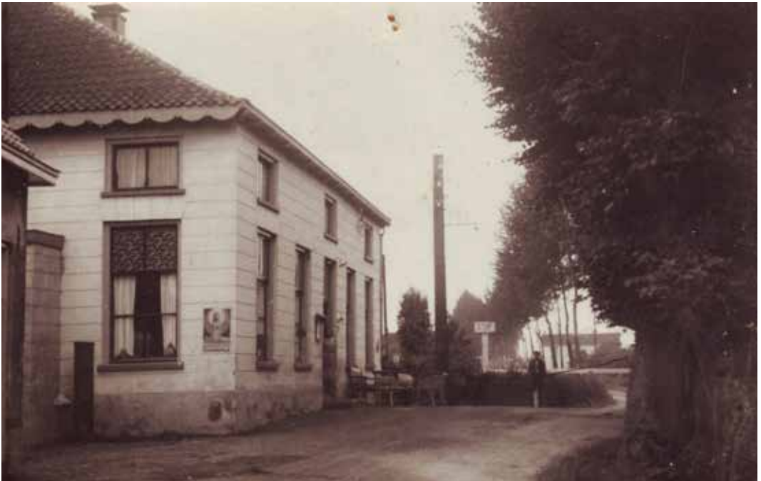
Café De Tol in Kapel-Avezaath