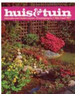
Blad Huis & Tuin