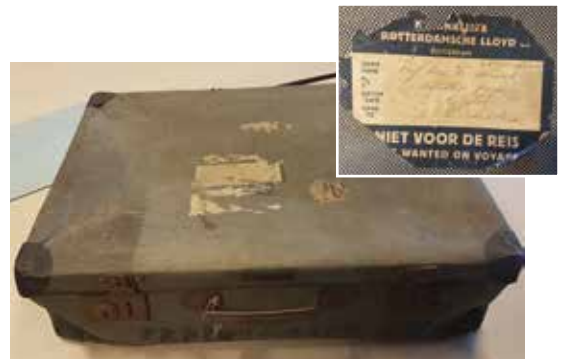
Voorraanzicht koffer Inzet: etiket op de koffer