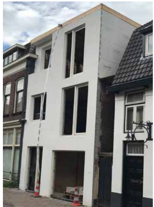
Het pakhuis is gesloopt, de nieuwbouw begonnen