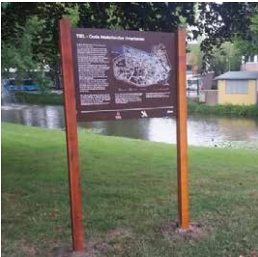
Het nieuwe informatiebord aan het Kalverbos