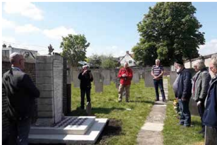
4 mei 2020

Huisman stond, net als een vertegenwoordiger van de stichting Ter Navolging Tiel, stil bij het 'nooit vergeten' en dat wij 75 jaar geleden wel van de nazi's werden bevrijd maar dat er van 'vrijheid' in lang niet alle opzichten sprake was en is. Ca. twintig personen maakten van de gelegenheid gebruik om de negenentwintig leden van de Joodse Gemeente Tiel, die slachtoffer werden van de nazi-terreur, te herdenken.