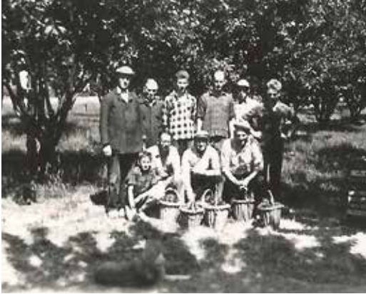
In de kersenboomgaard

Als de kersen af waren, werd er heel wat gedronken. Menigeen werd dronken afgevoerd, wat hun vrouwen niet leuk vonden! Ik weet nog dat ik ook had meegedronken, drie flesjes bier op, dus een beetje aangeschoten naar huis. Thuisgekomen werd in het achterhuis een streep met krijt getrokken waar ik over heen moest lopen, wat natuurlijk niet lukte. Dus toch dronken! Ik zat toen op de Tuinbouwschool en had veel vrij en daardoor tijd genoeg om te werken in de kersentijd. Veel mannen uit het dorp zaten in de kersenpluk. Het kersen keren gebeurde veelal vanaf het schavot op zo'n tien meter hoogte. Vanaf het schavot waren touwen gespannen die naar andere bomen leidden en daaraan waren bussen bevestigd met keien erin, die dan rammelden. Als een dubbele kers werd gevonden werd zij ingepakt en moest de 'keerder' die gaan overhandigen aan de baas/eigenaar van de bogerd en wachten op een fooi, waarvan drank werd gekocht om de kelen te laven. De fles en een glas gingen rond onder de plukkers. Er waren plukkers die pruimden, dus je moest geen smetvrees hebben!