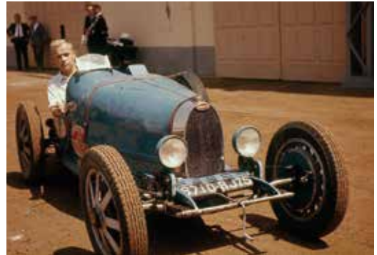
Gies bezoekt Molsheim in Frankrijk, en rijdt daar in een Bugatti