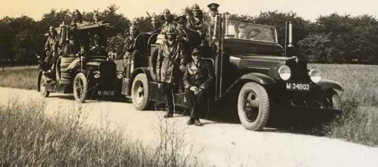
De Tielse brandweer in de jaren dertig; voor op de treeplank de stadsbaas

besmettelijke ziekten, eigenlijk het eerste ziekenhuis dat in Tiel gebouwd werd. 4 Vanaf 1901 kon men hier met behulp van een speciale oven ook kleding ontsmetten. Pieterella Breur, echtgenote van de stadsbaas, kreeg er een aanstelling als helpster bij de ontsmettingsoven.