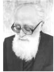
Portret drs. Friedrich Weinreb. 1910-1988