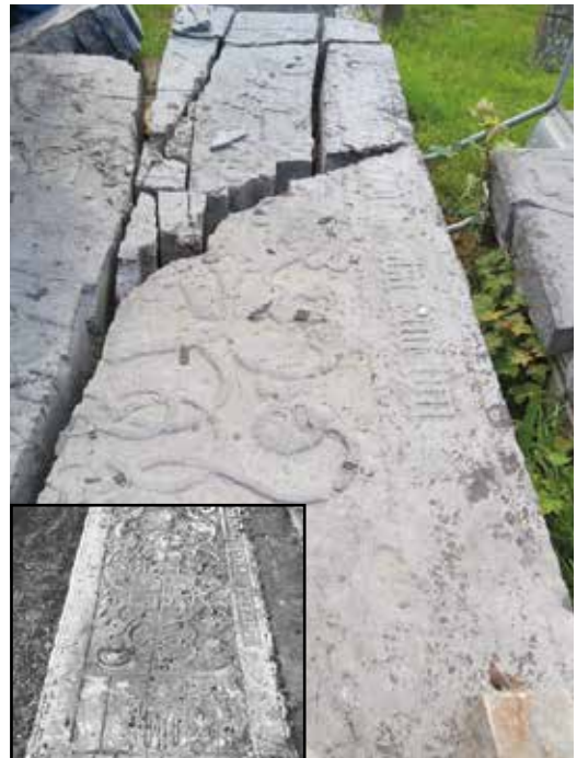
Mei 2020 inzetjes, jaren 30