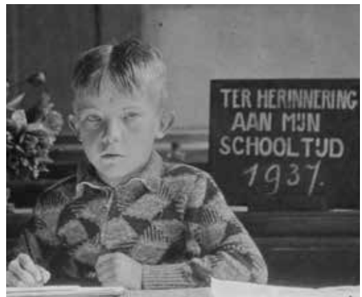
Gies in de schoolbanken