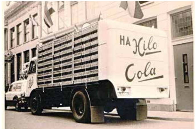
📍 Hilo vrachtauto bij de fabriek in de Voorstad