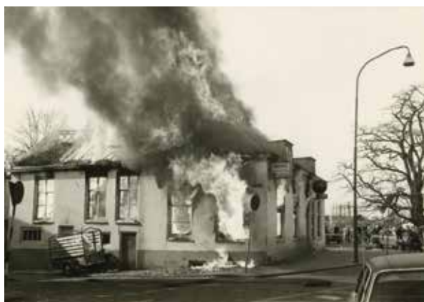
⚠ Een felle uitslaande brand legde op 9 april 1976 De Blauwe Hand in de as.

Ook in de jaren zestig blijft het café z’n maatschappelijke schakelfunctie behouden. Toen een firma stuwadoors zocht voor ‘afwisselend werk in de buitenlucht’ in de Rotterdamse haven, konden geïnteresseerden zich in De Blauwe Hand melden.