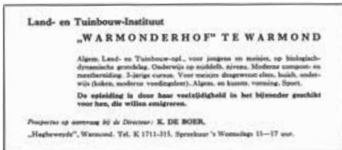
Wervingsadvertentie in 1954 (Particulier bezit)