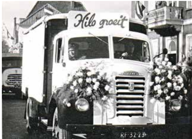
📍 Hilo vrachtauto op het Kalverbos

Na Coca Cola en Pepsi Cola werd Hilo al snel het derde grote merk in Nederland. Het zwaartepunt van de afzet was het Rivierengebied en de randen daarom heen. Maar het bedrijf leverde de bruine limonade ook in de rest van het land. Een heel wagenpark kruiste iedere dag de Nederlandse wegen. Hilo was niet zo kapitaalkrachtig dat het splinternieuwe vrachtauto's en bestelbussen kon kopen. Het waren allemaal tweede- en soms derde- of vierdehandsjes, waaronder nog enkele legervoertuigen van geallieerden. Die auto's zagen er na een spuitbeurt, met witte lak en met bruin het woord Hilo op verschillende plaatsen, toch representatief uit. Het succes van Hilo kwam naast een billijke prijs door het totaalpakket aan dranken en diensten dat Wam leverde. Naast 'cola' en de sinaslimonade leverde hij bier, wijn en een breed assortiment gedistilleerd. Wie dat wilde kon ook gratis speelautomaten in zijn café of sportkantine krijgen.