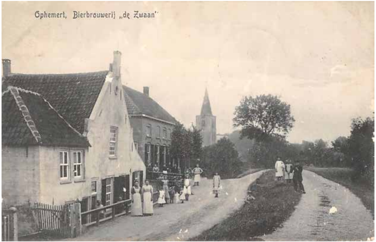
📷 Oude foto van bedrijfspanden Ophemert 1906

Omstreeks 1618 werd in Ophemert voor het eerst bier gebrouwen. In de loop der eeuwen kwam de brouwerij, die wanneer je met de rug naar de Waal staat direct links naast het huidige restaurant het Dijkhuis lag, in verschillende handen. In 1816 verkocht de toenmalige eigenaar Cornelis van Aalst de brouwerij met een inpandig woonhuis door aan Paulus van den Berg, een bakker uit Dreumel. Sindsdien zou de familie Van den Berg, waarvan de naam mogelijk door een fout van een gemeentebtenaar later gewijzigd werd in Van den Bergh, een belangrijke rol spelen in de drankvoorziening van Ophemert en omstreken.