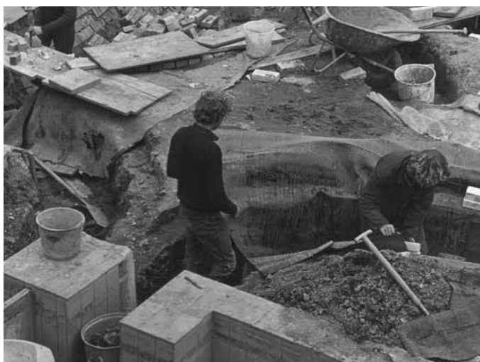
📍 Aanleg flowforms; onderzoekproject met als doel het afvalwater van de Warmonderhof te zuiveren