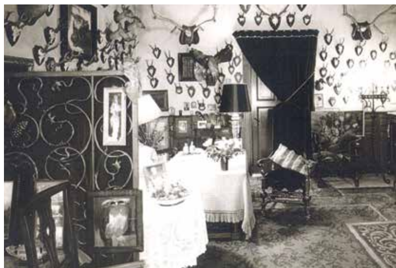
De hal met jachttrofeeën

Het is dus goed voor te stellen dat Itty zich onprettig voelde in het grote lege,