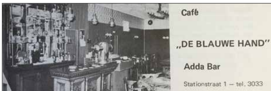
⚠ Advertentie uit Adresboek voor Tiel, 1970