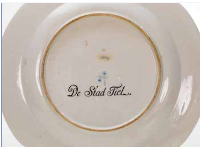
▲ De achterzijde van het bord met de herkomst uit Meissen