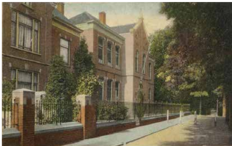
De in 1904 opgerichte christelijke Wilhelminaschool aan de Achterweg met links de onderwijzerswoning.