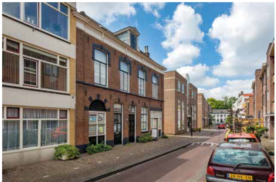
📍 Eerste vestiging van Hilo, Gasthuisstraat 31-33. De toog boven het raam van het linkerdeel was de plaats waar de vrachtauto's naar binnen reden