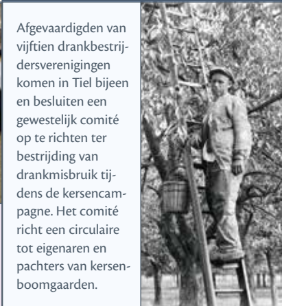
Afgevaardigden van vijftien drankbestrijdersverenigingen komen in Tiel bijeen en besluiten een gewestelijk comité op te richten ter bestrijding van drankmisbruik tijdens de kersencampagne. Het comité richt een circulaire tot eigenaren en pachters van kersenboomgaarden.