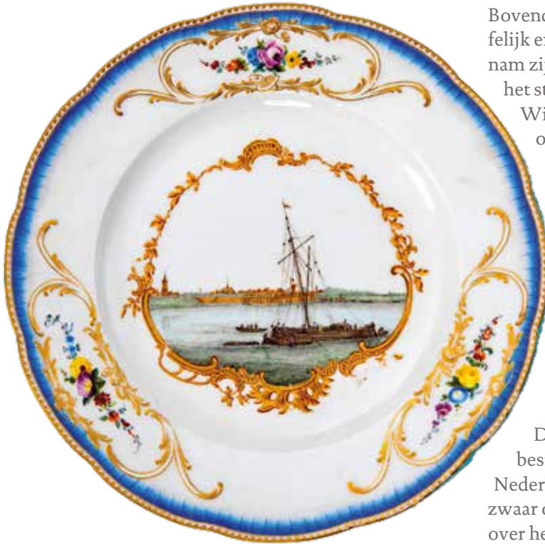
📍 Het bord met de afbeelding van Tiel

In december 2020 moest het Tielse museum afstand doen van een bijzonder object. Het betrof een bordje met een schildering van de stad Tiel in de achttiende eeuw. Het verhaal van dit bord is te bijzonder om het niet te vertellen.