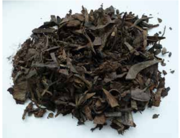
♣ Snijafval van een leerbewerker. Vindplaats Westluidensestraat Tiel.