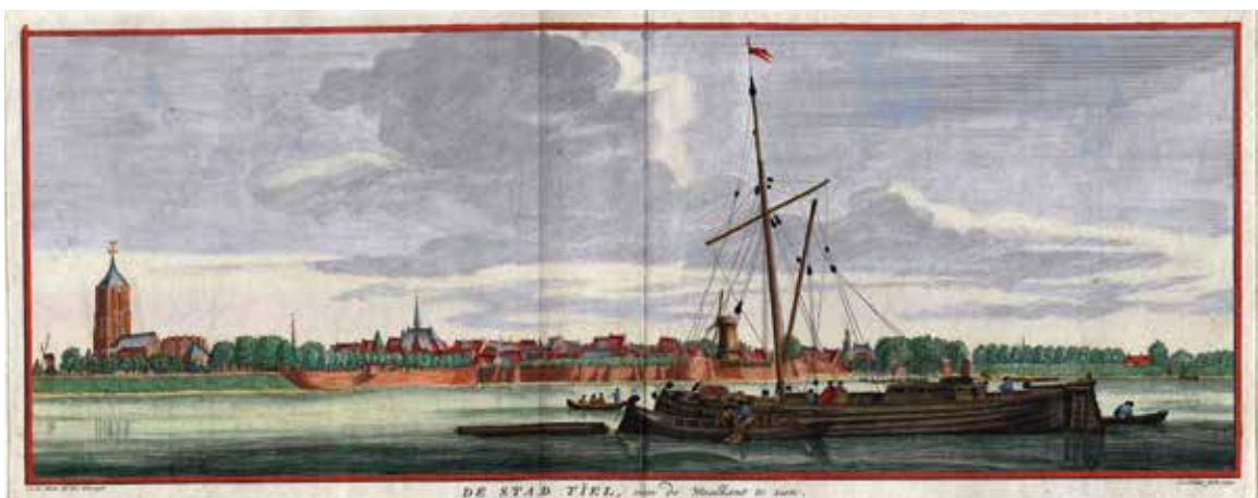
Gezicht op Tiel 1740