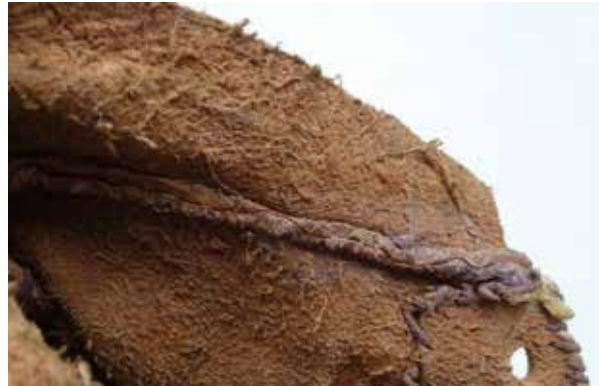
♣ Reconstructie van een middeleeuwse schoen gemaakt door Guus Taconis. Op het detail aan de binnenzijde is de retourné techniek te zien waarbij de stiknaden aan de binnenzijde van de schoen zitten. (Collectie BATO/foto Jan van Oostveen)