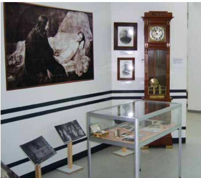
▲ Overzichtsfoto van de expositie in Ziekenhuis Rivierland in 2010 ter gelegenheid van het 100-jarig bestaan van het voormalige ziekenhuis Bethesda.

Het is bijzonder te zien dat de inspanningen van de zusters Spiering op kerkelijk gebied, de ziekenzorg en het onderwijs tot in de huidige tijd voortgezet worden. Men kan zich wel afvragen of de hedendaagse emancipatie van vrouwen en meisjes zou voldoen aan de normen van de zusters. Maar in hun tijd hebben ze daaraan voortvarend en met toewijding gewerkt en wellicht daarmee een zaadje geplant. Met de rente van het opgebouwde kapitaal worden op aanvraag in Tiel en omgeving door de curatoren subsidies verstrekt aan kerkelijke instellingen en/of -initiatieven. Een verdiend extra eerbetoon aan de 'dames Spiering' is de in 2010 door de Fundatie ingestelde 'Spieringprijs', een tweejaarlijks onderscheiding voor nieuwe of vernieuwende initiatieven in de zorg, gericht op instellingen in Tiel en de wijde omtrek. Nog in datzelfde jaar werd onder het motto 'Met passie en toewijding' uitgebreid stilgestaan bij het 100-jarig bestaan van het door de 'dames Spiering' gestichte ziekenhuis Bethesda. Dat gebeurde door de uitgave van een herdenkingsboek, lezingen, een grote expositie in de hal van het ziekenhuis en het voor de eerste keer overhandigen van de 'Spieringprijs'.