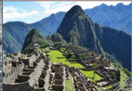
De Amerikaanse ontdekkingsreiziger Hiram Bingham herontdekt op 24 juli de ruïnes van de 15e eeuwse Inca-stad Machu Picchu op een 2430 meter hoge bergrug in Peru. Machu Picchu staat op de UNESCO erfgoedlijst.