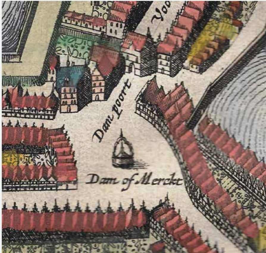
DE SITUATIE VÓÓR 1646.

Van veel plaatsen in Tiel kan men stellen, dat ze veranderd zijn. Aan de hand van beelden is mooi te volgen, hoe dat gebeurde.