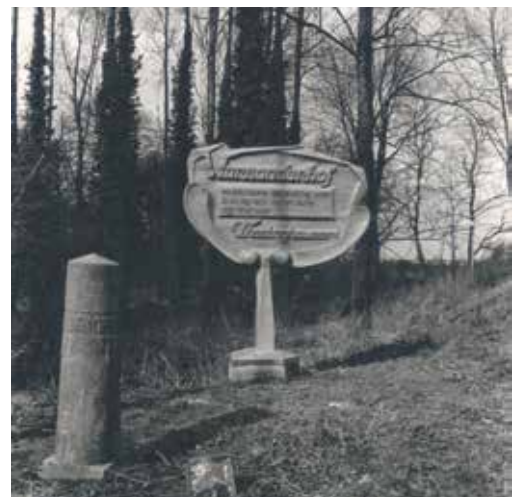
▲ Thedingsweert-Warmonderhof ingang Lingeweg