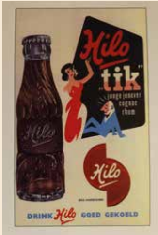
▲ Reclame voor Hilo tik