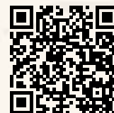
Video: Oprichting Stichting Carillon Tiel