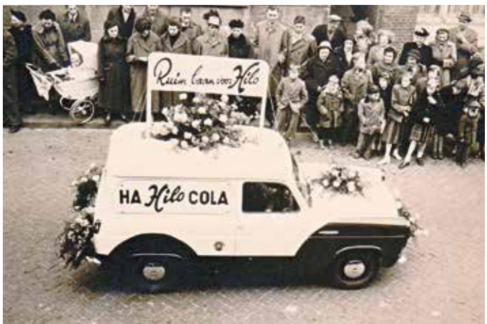
📍 Hilo reclame tijdens een optocht