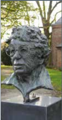
Op 20 mei wordt Annie M.G. Schmidt in Kapelle geboren. Generaties Nederlanders zijn met haar poëzie en verhalen opgegroeid.