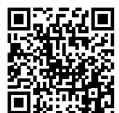
Video: Opening nieuwe accommodatie BATO