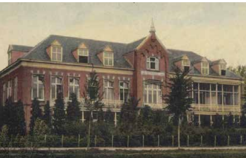
⊕ Achtergevel van het voormalige ziekenhuis Bethesda dat in 1910 werd gebouwd en in 1984 werd afgebroken voor het seniorencomplex 'De Brug'.

Over het reilen en zeilen van het grote gezin is nagenoeg niets bekend. De kinderen hebben wellicht een periode thuis basis-onderwijs gehad, want uit het bevolkingsregister blijkt dat vanaf oktober 1858 de onderwijzer Egbertus Antoni Schrader ook in huis woonachtig was. Maar die vertrok al na twee jaar. Hoe voor die tijd de kinderen en later de jongste drie kinderen hun onderwijs kregen is niet meer na te gaan.