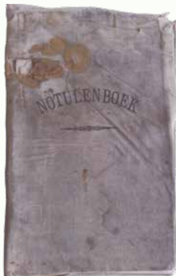
📖 Notulenboek Tielse horeca (Collectie RAR)

We ontvingen van de heer Van Os uit Tiel (getrouwd met een kleindochter van de eigenaar van café het Zwijnshoofd) een prachtig notulenboek. Het is van de Bond van Vergunninghouders, afdeling Tiel en omstreken en bevat notulen uit de periode 1923-1941. De afdeling is opgericht in 1909. Het boek is een mooie bron voor de geschiedenis van de horeca in Tiel. Het boek heeft toegangsnummer 1575-628 en is digitaal in te zien op website RAR : https://hdl.handle.net/21.12108/A01DC452FFB943FE84136C-B30A786513