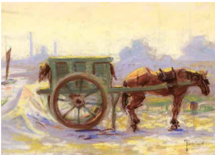
📍 Johan Ponsioen, Paard en wagen, Pastel