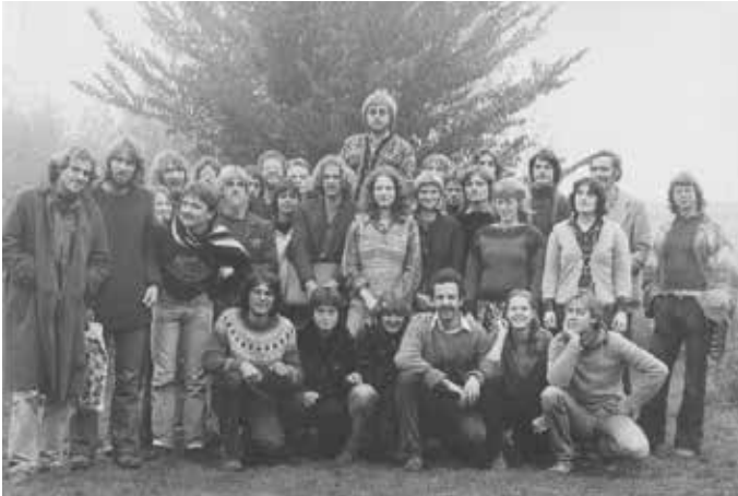
📷 Klassenfoto 1978

Thedingsweert biedt namelijk niet genoeg ruimte voor zoveel leerlingen. Een legale oplossing wordt gevonden in de oprichting van de stichting WarmOnderDak. Deze stichting huurt van woningbouwverenigingen en van de gemeente Tiel panden om studenten onderdak te bieden. Maar ook niet legale middelen worden door de studenten gebruikt om aan woonruimte komen. Een oud bewoonster van de toenmalige huizen aan de Wethouderskade herinnert zich nog heel goed dat zij zo ongeveer de enige legale bewoner was van het rijtje ‘te slopen huizen’ aldaar. De rest was gekraakt door Warmonderhoffers. “Leuke, gezellige lui, maar voor Tiel erg uitzonderlijk en met een frequent drugsgebruik (plantjes kweken was tenslotte een deel van hun opleiding)”. De interactie met de omgeving wordt ook gevormd door de stages die de leerlingen moeten doen bij bedrijven in de omgeving. Door hun meestal niet-agrarische achtergrond is het voor leerlingen een hele cultuurschok. Dat geldt overigens ook voor de boeren in de omgeving. “Vegetarisch, wat is dat? Da’s prima, maar niet onder het eten”. Achteraf kijken de meeste boeren terug op een leuke tijd met de leerlingen en hebben het als een bijzondere belevenis ervaren om bijvoorbeeld die stadse mensen te leren melken.