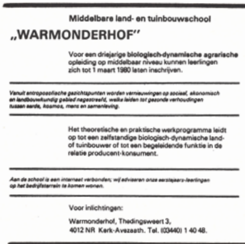
Wervingsadvertentie in 1980