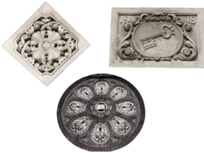
▲ Roosvenster uit de Eben Haëzerkerk, vervaardigd door G.W. Entink. Het middenstuk is tegenwoordig boven een deur van een woning aan de Stationsstraat bevestigd. Waar de rest is gebleven is onbekend.