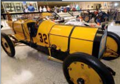
De eerste Indianapolis 500 werd gereden op 30 mei op de Indianapolis Motor Speedway. Ray Harroun (Amerikaan) won de race in de Marmon Wasp. Deze auto kun je nog zien in het Indianapolis Motor Speedway Museum.