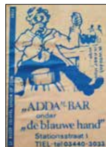
⚠ Luciferdoosje van de Adda Bar (Particulier bezit)

Hand een beatkelder, de Adda Bar, te bereiken via een ingang aan de kant van de Boterkampsteeg. “Met vreugde geven wij kennis van de geboorte van het bierkindje Adda” luidde de ludieke advertentie in de Nieuwe Tielse Courant van oktober 1966. Jongeren konden er elkaar ontmoeten. Onder de naam ‘Adda Boys’ deed een (café)team mee aan het Bedrijfs- en Zomeravondvoetbal in Tiel. 6 Vijf jaar weet deze jeugdbar de deuren open te houden, want nadat café het Waghenwiel in de Weerstraat voorjaar 1971 door brand was verwoest, kon onder de naam het Wagenwiel (dus zonder de letter h) een doorstart gemaakt worden in de ruimte van de Adda Bar.