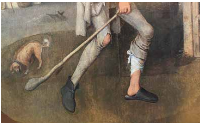
♣ Laat-middeleeuwse schoen en muil. Detail uit het schilderij De Marskramer, door Jheronimus Bosch, circa 1493 (Collectie Museum Boijmans van Beuningen, Rotterdam)