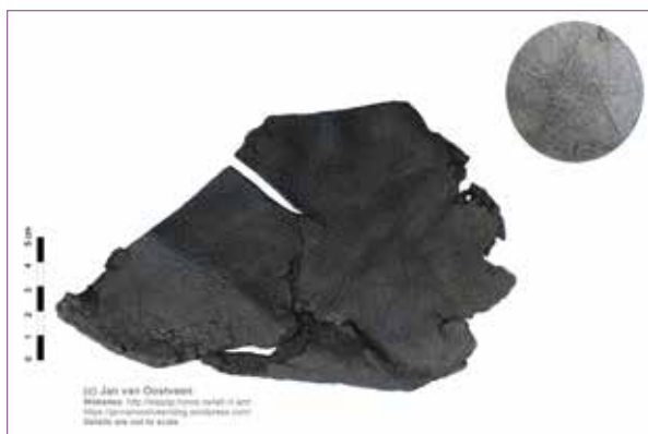
Ⓜ Voorblad van een leren schoen met in detail een foto van het ingekraste pentagram.

De vondst betreft een leerfragment dat waarschijnlijk in de Westluidensestraat in Tiel is opgegraven (depotnummer U4). Wanneer nauwkeurig naar het leerfragment wordt gekeken is zichtbaar dat aan alle zijden stiknaden zitten. Het stuk leer is binnenstebuiten genaaid (zogenaamde retourné methode) om te voorkomen dat tijdens het dragen de naden snel zouden slijten. Doordat slechts één leerfragment is gevonden betekent dit dat het stuk leer een onderdeel is geweest van een groter geheel.