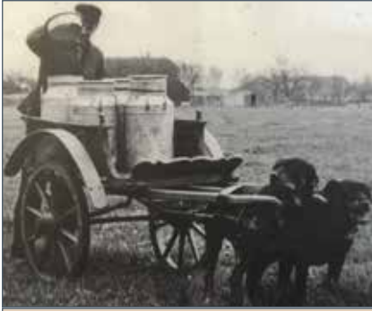
In september treedt de Trekhondenwet in werking. Deze wet moet verbetering brengen in de leefomstandigheden van de trekhonden. (Openluchtmuseum de Locht)