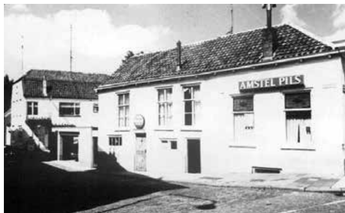
▲ De zijgevel van De Blauwe Hand aan de kant van de Boterkampsteeg.

In de jaren zestig versnelt de hartslag van de maatschappij. De jeugd eist een plaats op met een eigen cultuur en vernieuwende muziek. Traditionele cafés moeten de bakens verzetten. Om jeugdigen te trekken komt er bij De Blauwe