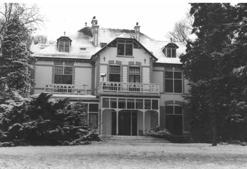
Thedingsweert