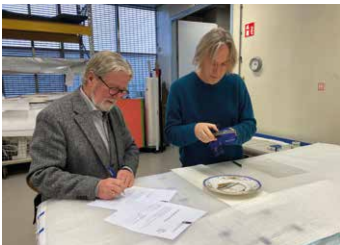
▲ De overdracht van het bord in Rijswijk