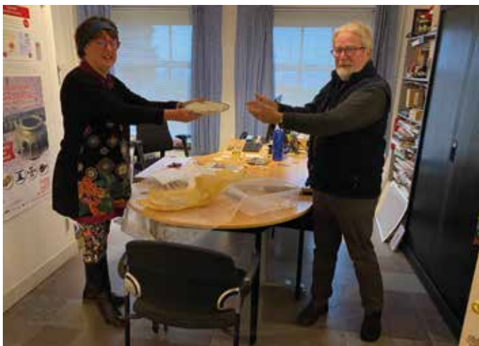
▲ De terugkeer van het bord van museum naar Oudheidkamer