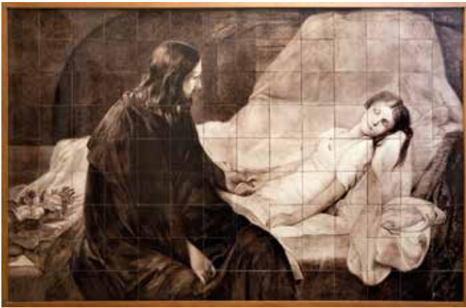
▲ Tegeltabelau met Christus die het dochtertje van Jäirus opwekt. In 1916 voor het ziekenhuis vervaardigd en geschonken door jvr. A.J. de Beaufort-Hoeufft. Sinds 1975 in verpleeghuis Vrijthof.

De curatoren, die tot dan niets hoefden te doen, kwamen nu in functie. In de loop der jaren werden de gebouwen verkocht en de opbrengsten bij het vermogen gevoegd. Uiteindelijk heeft het bestuur van de Fundatie de doelstellingen aangepast aan de veranderde maatschappij en kerkelijke samenleving, daarbij wel het gedachtengoed van de zusters Spiering als beleidslijn in het oog houdend.