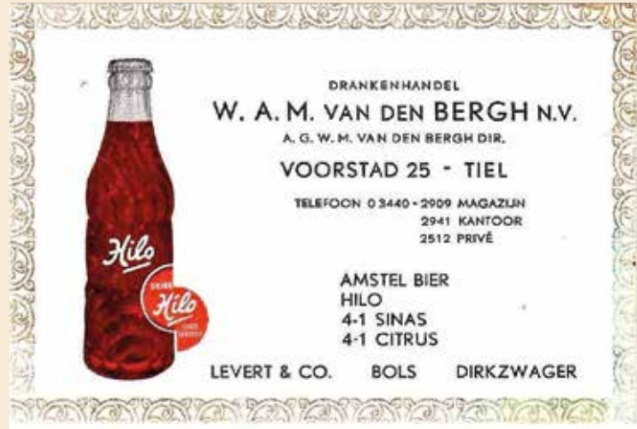
▲ Kaartje firma Van den Bergh

Heineken de afnemers van zijn bier onder druk om over te stappen op de frisdranken van Vrumona. Tegelijkertijd begonnen ook andere frisdrankproducenten en brouwerijen met de productie van een namaakcola. Daardoor nam de concurrentie toe. De gevolgen hiervan merkte Hilo in een gestaag toenemend verlies aan afnemers. Medewerkers zagen met angst in het hart de stapels lege fust op het terrein groeien en de productielijnen stonden steeds vaker stil. Dat gebeurde in een tijd waarin de financiële reserves door de verhuizing naar Latenstein en de aankoop van een moderne nieuwe productielijn toch al benard waren. Daar kwam bij dat een duur project om de geproduceerde frisdranken ook aan te bieden in tankjes, iets wat sterk in opkomst kwam, mislukte.