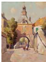
Omslagfoto: De Waterpoort. Olieverfschilderij door Jan Knikker sr., circa 1930.

De redactie van de Nieuwe Kroniek is op zoek naar nieuwe artikelen van historische onderzoekers (beroeps- of hobbymatig) over Betuwse gebeurtenissen, personen of plekken. Artikelen worden beoordeeld en van advies voorzien door de redactie. De redactie kan helpen bij het beter leesbaar maken en de afbeeldingskeuze.