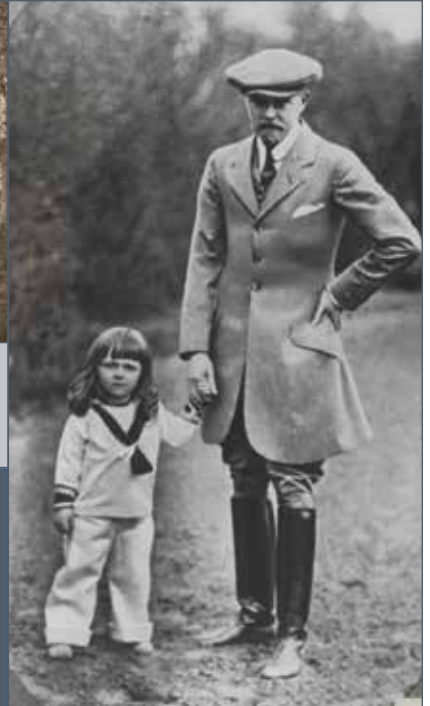
Bernhard van Lippe-Biesterveld werd geboren op 29 juni in Jena, Duitsland. De 3-jarige prins Bernhard maakt aan de hand van zijn vader, prins Bernhard Kazimir een wandelingetje.