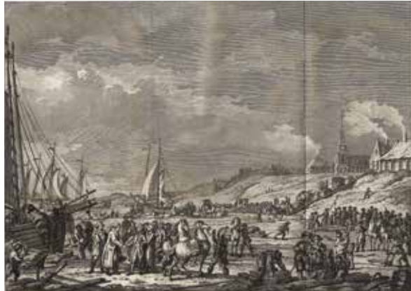
De vlucht van stadhouder Willem V in 1795

Vanaf 1793 was Nederland in oorlog met het revolutionaire Frankrijk. De Fransen hadden het vooral gemunt op stadhouder Willem V die gold als vertegenwoordiger van het Ancien Régime. In 1794 veroverden de Fransen het zuiden van het land en door het bevroren van de grote rivieren konden ze in januari 1795 eenvoudig doorbreken naar het noorden. Zo viel Tiel bijvoorbeeld op 7 januari 1795 in hun handen. De stadhouder wist, dat zijn dagen geteld waren en vluchtte op 18 januari naar Engeland. Hij vreesde – terecht – dat hij nooit meer naar Nederland zou kunnen terugkeren. Om die reden nam hij veel van zijn bezittingen mee. Daarbij was ook zijn kostbare Meissenservies. Het zal niet de specifieke gehechtheid aan het mooie porselein zijn geweest, waarom dat gebeurde.