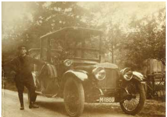
De auto van de ‘dames’. Een Packard uit 1905 met een verhoogd koetswerk voor de hoeden.