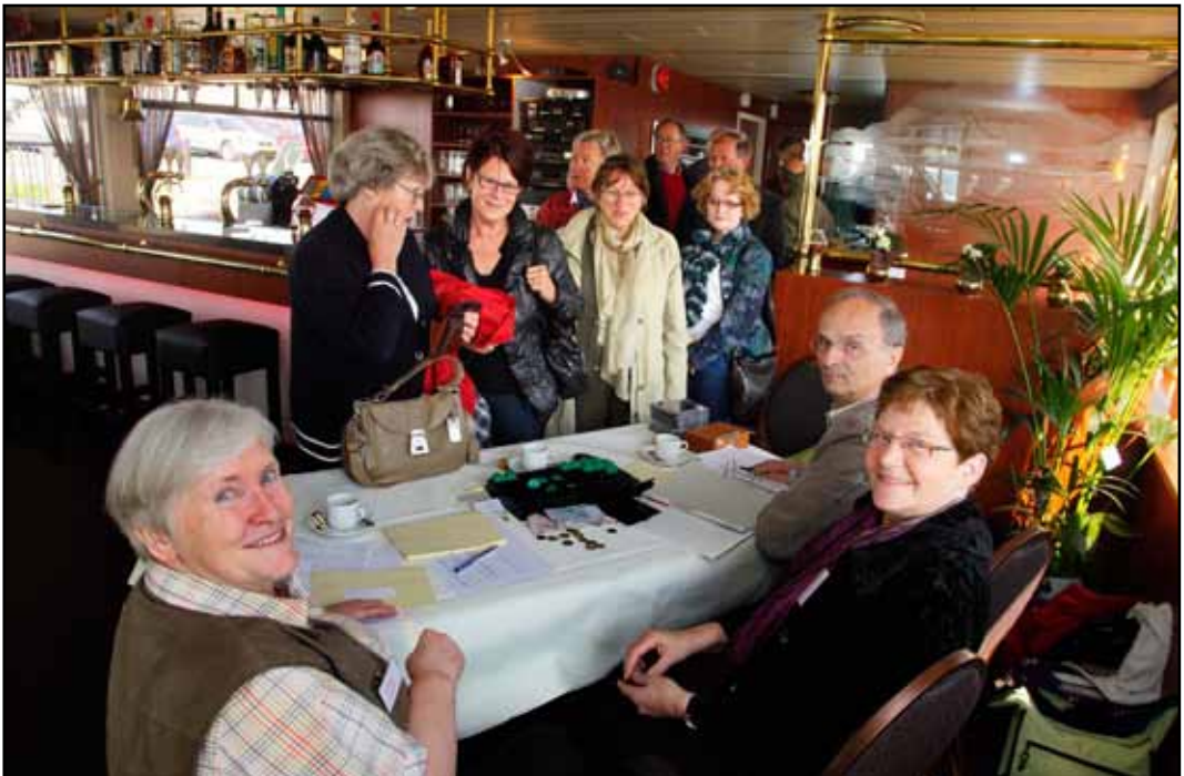
In de rij voor het tafeltje om te betalen...

Hé, een man met dezelfde naam op zijn badge als een veelvoudig moordenaar eind jaren zestig. Och ja, grinnikt hij, dat heeft hij al zo vaak gehoord, maar hij wordt er niet chagrijnig van, zegt hij. “Ik heb ooit een gevangenenbewaker gesproken bij wie die .... .. zat en die man zei dat ik absoluut niet op hem leek. Hij was ook een jaar of vijftien of twintig ouder dan ik.” Maar voor móóie verhalen wijst hij op de