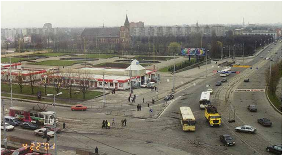
De oude binnenstad van Kaliningrad bleef een kale plek, alleen de dom, links achteraan, werd herbouwd.

Kaliningrad, dat was vroeger dus Königsberg, voordat deze hoofdstad van Oost-Pruisen door de geallieerden en daarna door de Russen verwoest werd.