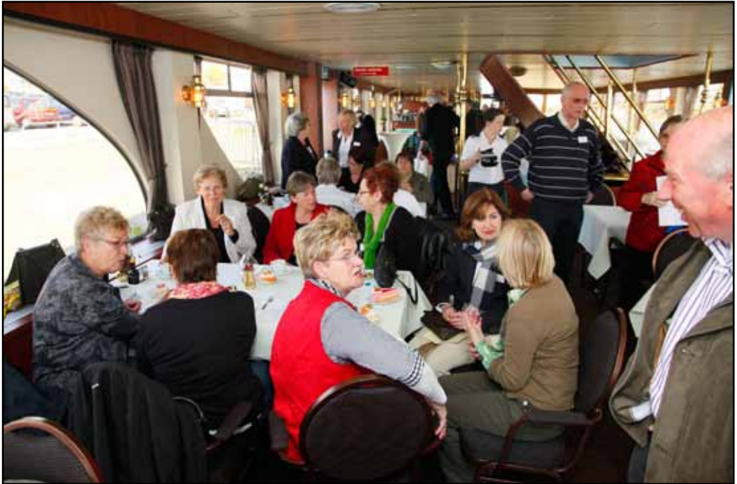
Als vier uur later de boot weer aanmeert aan de kade in Tiel, moeten enkele groepjes zo ongeveer van boord gejaagd worden...