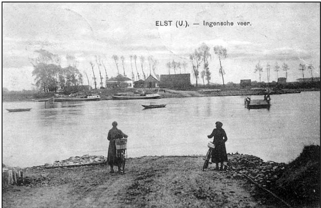
Wachten op het veer. Van welke periode de opname – op een Ansichtkaart – dateert is niet bekend.