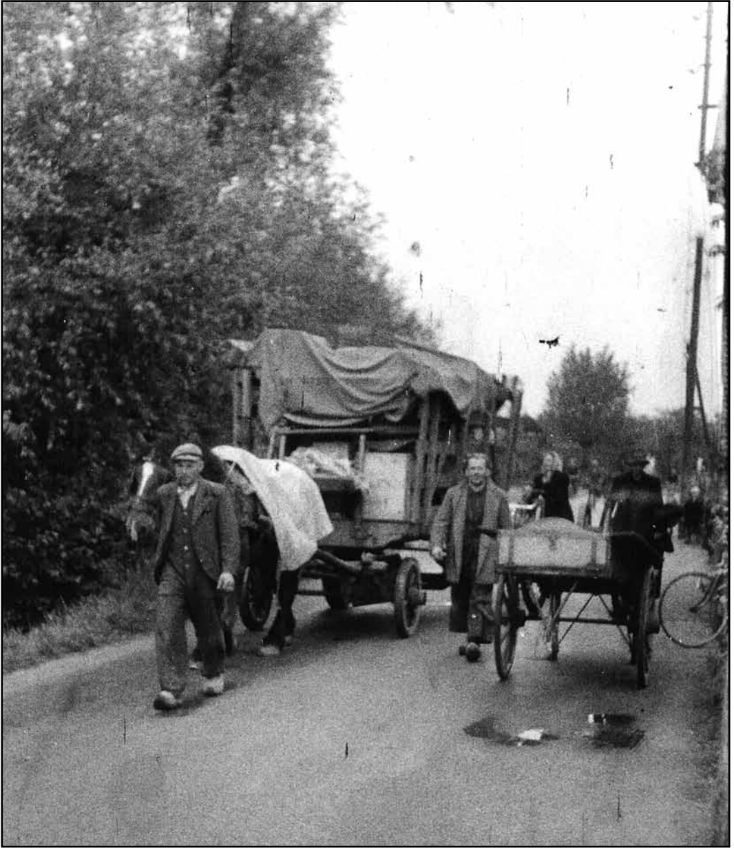
Beeld van evacués in Zoelen.