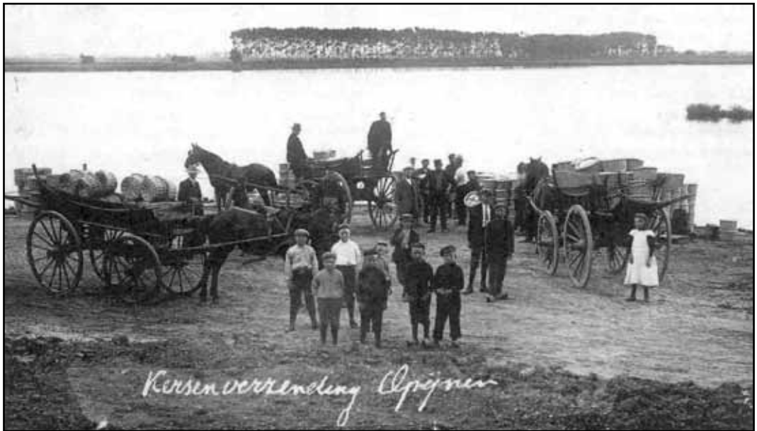
Kersen in Oprijnen wachten op verder vervoer over de Waal, omstreeks 1905. Let vooral op de prachtige boerenwagens, zeer karakteristiek voor het rivierengebied. Ansichtkaart / fotokaart.

uit de periode vanaf 1850 beschreven door het Instituut voor Nederlandse Geschiedenis. Al deze levensschetsen zijn digitaal op te roepen via de website www.inghist.nl . Bodegraven was vooral een radioman en werd het bekendst door grootscheepse inzamelingsacties. In deel 6 komen nog wel enkele personen voor die niet in Tiel geboren werden maar er wel hun sporen hebben nagelaten. Onder hen 'Rolly' ridder van Rappard (1906-1994) die opgroeide in Tiel en later burgemeester werd van Zoelen en Gorinchem. In de jaren zestig kreeg hij veel aandacht van de media om zijn extreem conservatieve ideeën. Uitgave: Instituut voor Nederlandse Geschiedenis, 615 blz., prijs 41 euro.