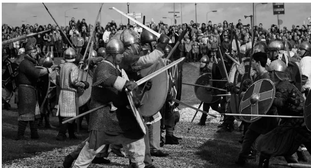
Op zaterdag 10 oktober showen 'Vikings' gevechten in Tiel.

Overweegt u het boek (250 blz. en 60 afbeeldingen, waaronder unieke foto's van de voormalige Joodse gemeenschap) aan te schaffen, dan kunt u (vrijblijvend) een reservering maken door een berichtje te sturen naar tjeerd.vrij@gmail.com (met vermelding van naam, adres en telefoonnummer; bellen mag ook: 06 – 53 59 17 22). U bent dan, in verband met de beperkte oplage, verzekerd van een exemplaar. (De prijs is nog niet bepaald, maar zal rond de 17,50 euro zijn). De presentatie van het boek is gepland in januari.