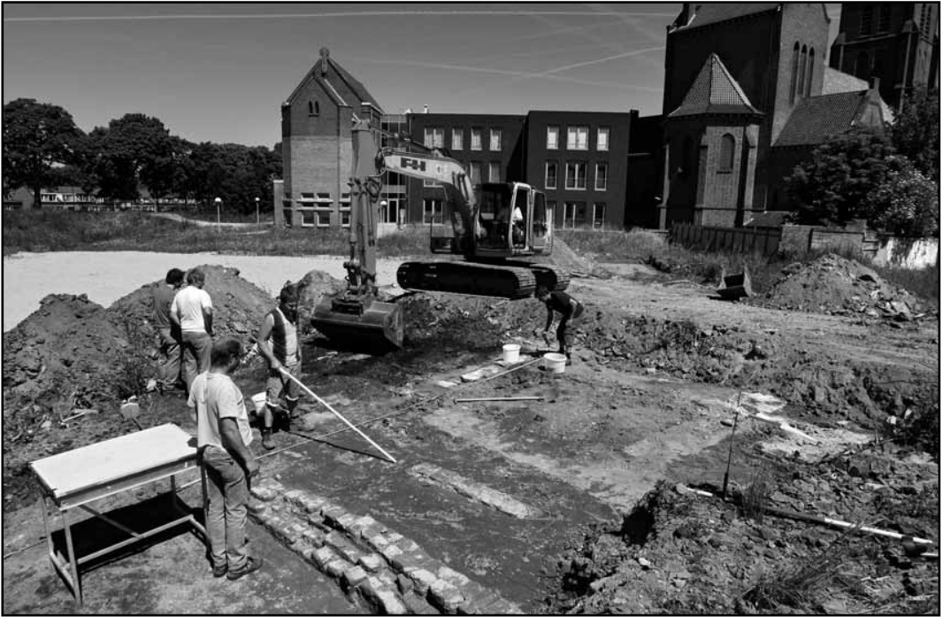
Het muurtje van een huis uit de 19de eeuw.