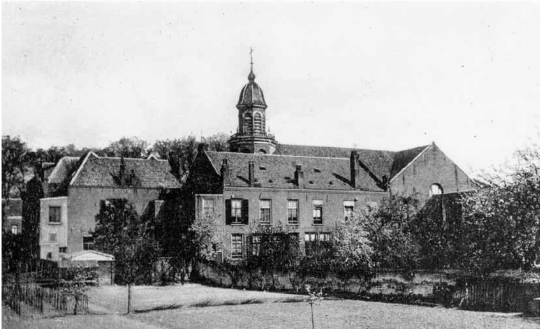
Klooster en oude Dominicuskerk, eind 19de eeuw