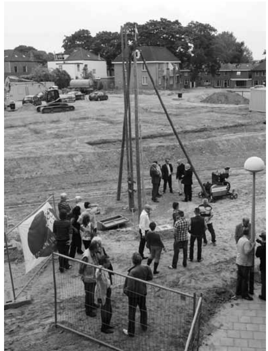
Slaan eerste paal

Langzaam maar zeker waren de zusters Dominicanessen hun werkterrein kwijtgeraakt. Het onderwijs ook aan meisjes werd nagenoeg geheel overgenomen door 'leken' en ook in het ziekenhuis nam het aantal nonnen af. Naast ontwikkelingen in de gezondheidszorg en het onderwijs speelde hierbij ook de afnemende belangstelling voor het kloosterleven een rol. In 1960 was het klooster nog uitgebreid met een nieuwe vleugel met slaapgelegenheden voor 40 zusters. Vrijwel direct na de ingebruikname nam het aantal nieuwe intredingen in kloosterorden gestaag af en kwam in de jaren daarna vrijwel tot stilstand. Het vergrijzingspook deed zijn intrede. In 2001 verlieten de laatste elf veelal hoogbejaarde zusters de stad.