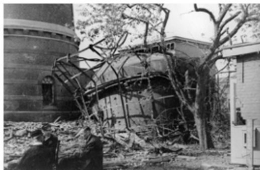
Het naar beneden gestorte waterreservoir