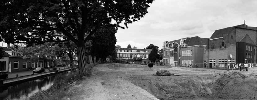
Hier komen 104 nieuwe woningen.