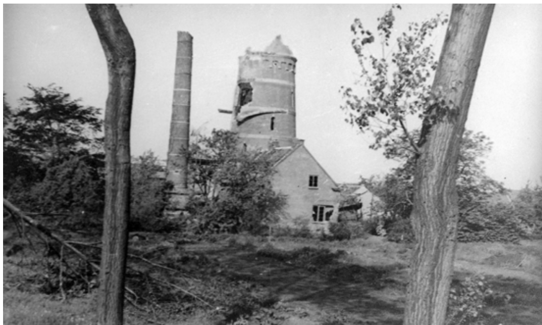
De watertoren vlak na de oorlog