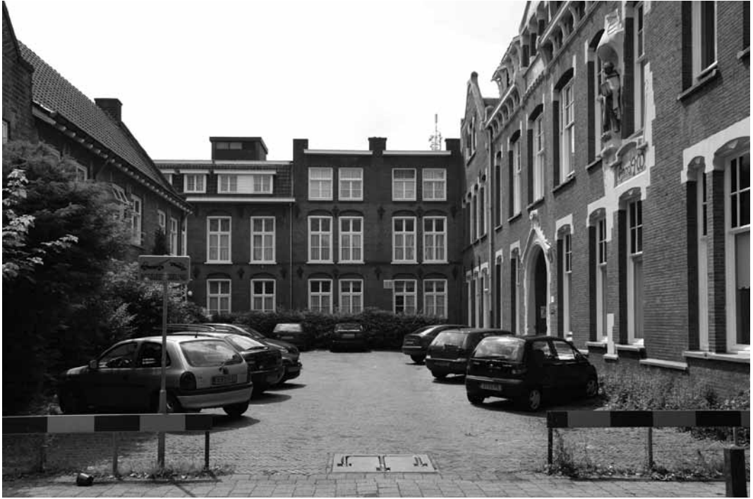
Pastorie (links), voormalig klooster (midden) en ziekenhuis (rechts)