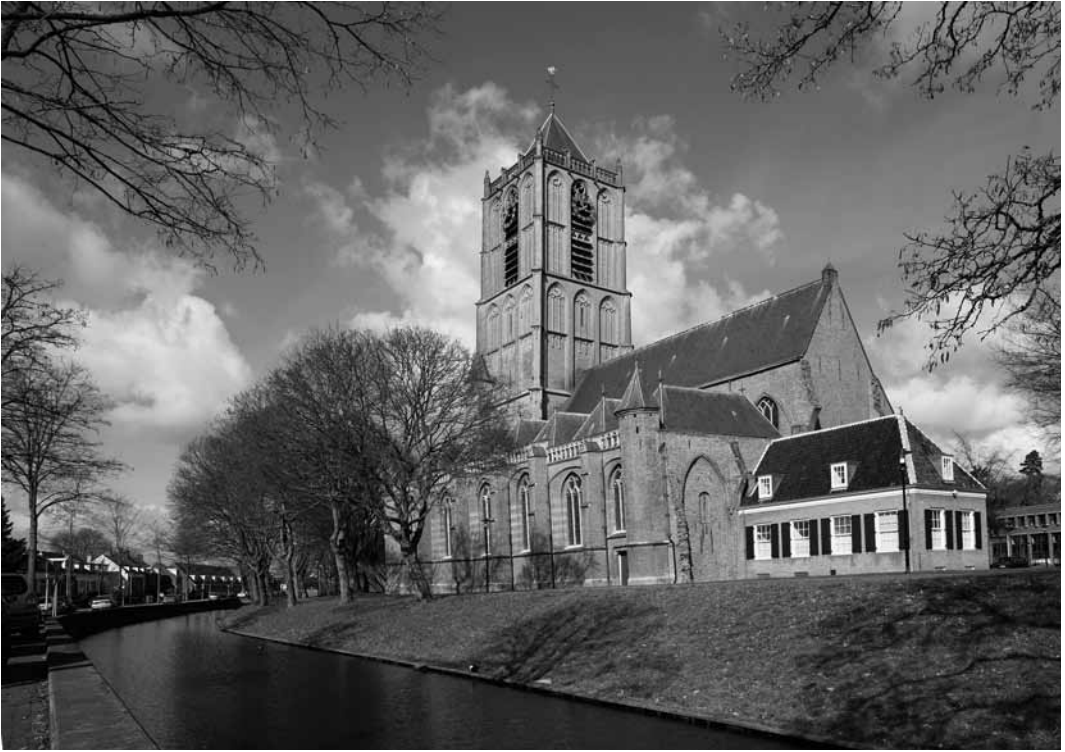
Een groot deel van de kerk dreigt straks achter een appartementencomplex te verdwijnen.