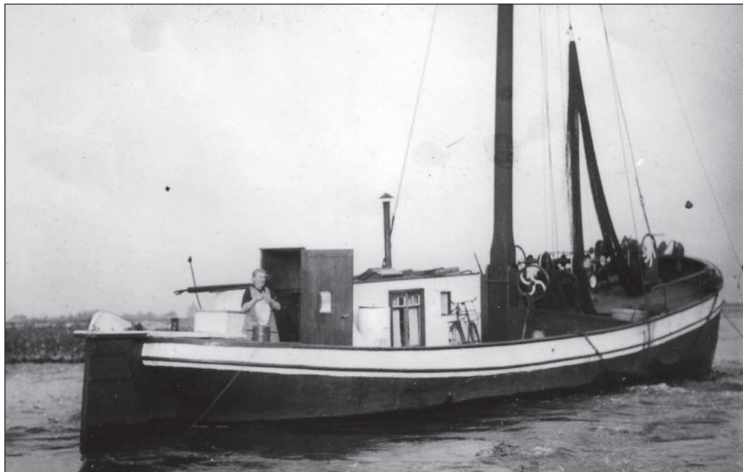
Tiel heeft ook een varend monument