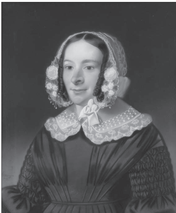
Schilderij van Jacoba Lambrechts.