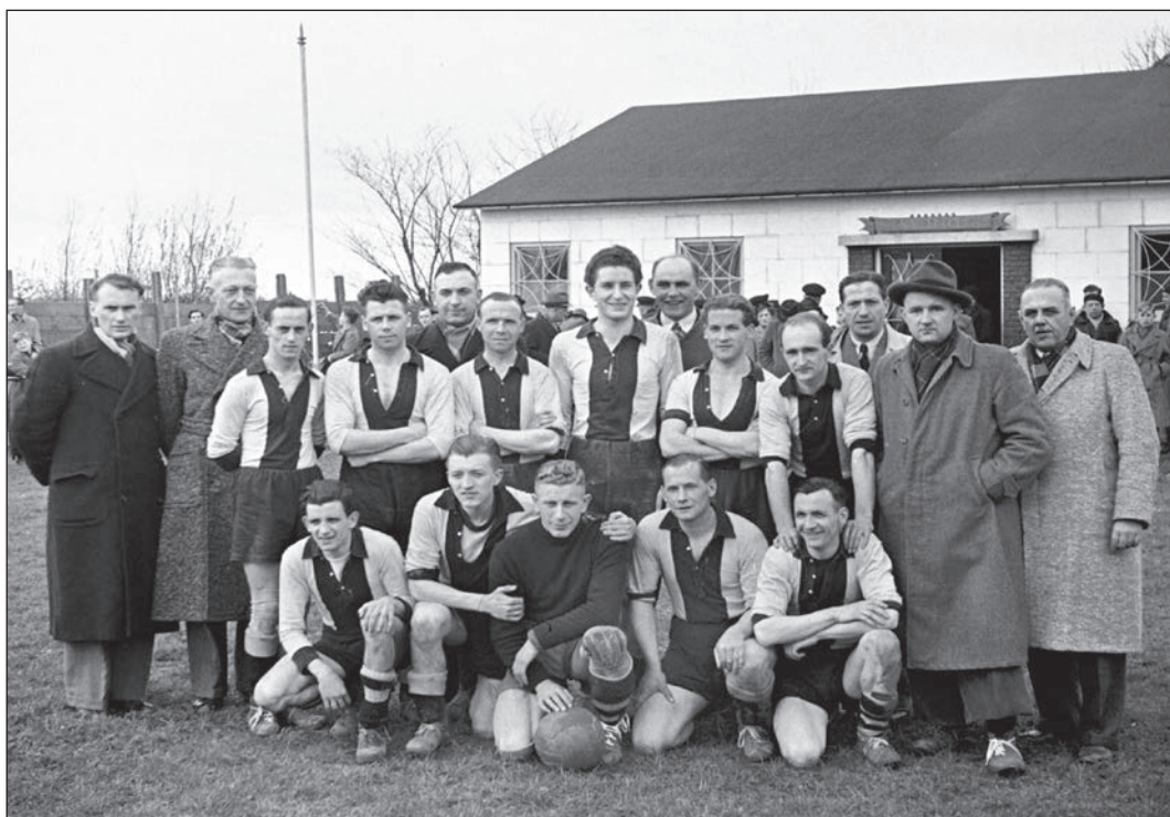
Het kampioenselftal van Theole in 1952.