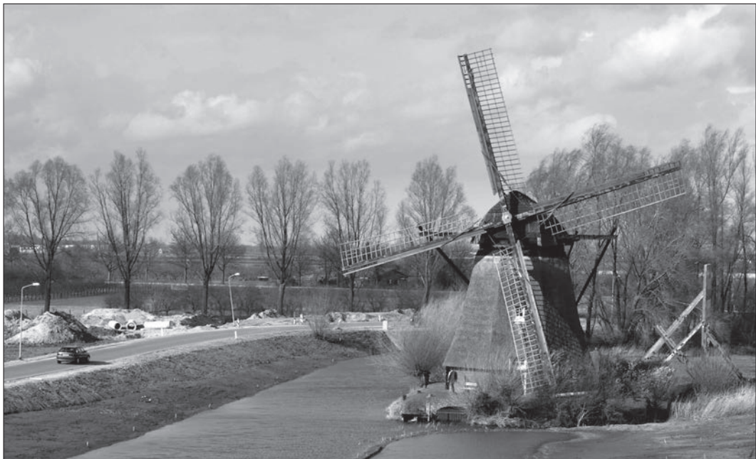
De poldermolen Wadenoijen op de oude locatie.

daan had. De molen is jarenlang gebruikt voor het bemalen van de Dorpspolder Wadenoijen. Bij een normale waterstand verloopt de afwatering naar de Linge op natuurlijke wijze. Bij hoog water was vroeger echter de hulp van poldermolens nodig. De Dorpspolder