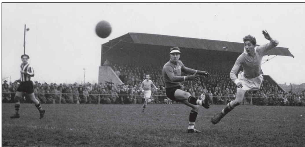
TEC in 1952 aan het werk.