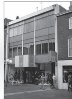
Promotiepaneel '125 jaar bouwen in Tiel' Bam-Beutener, periode 1923-1963.