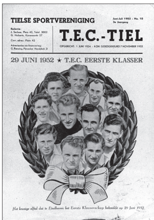
Het kampioenselftal van TEC in 1952.