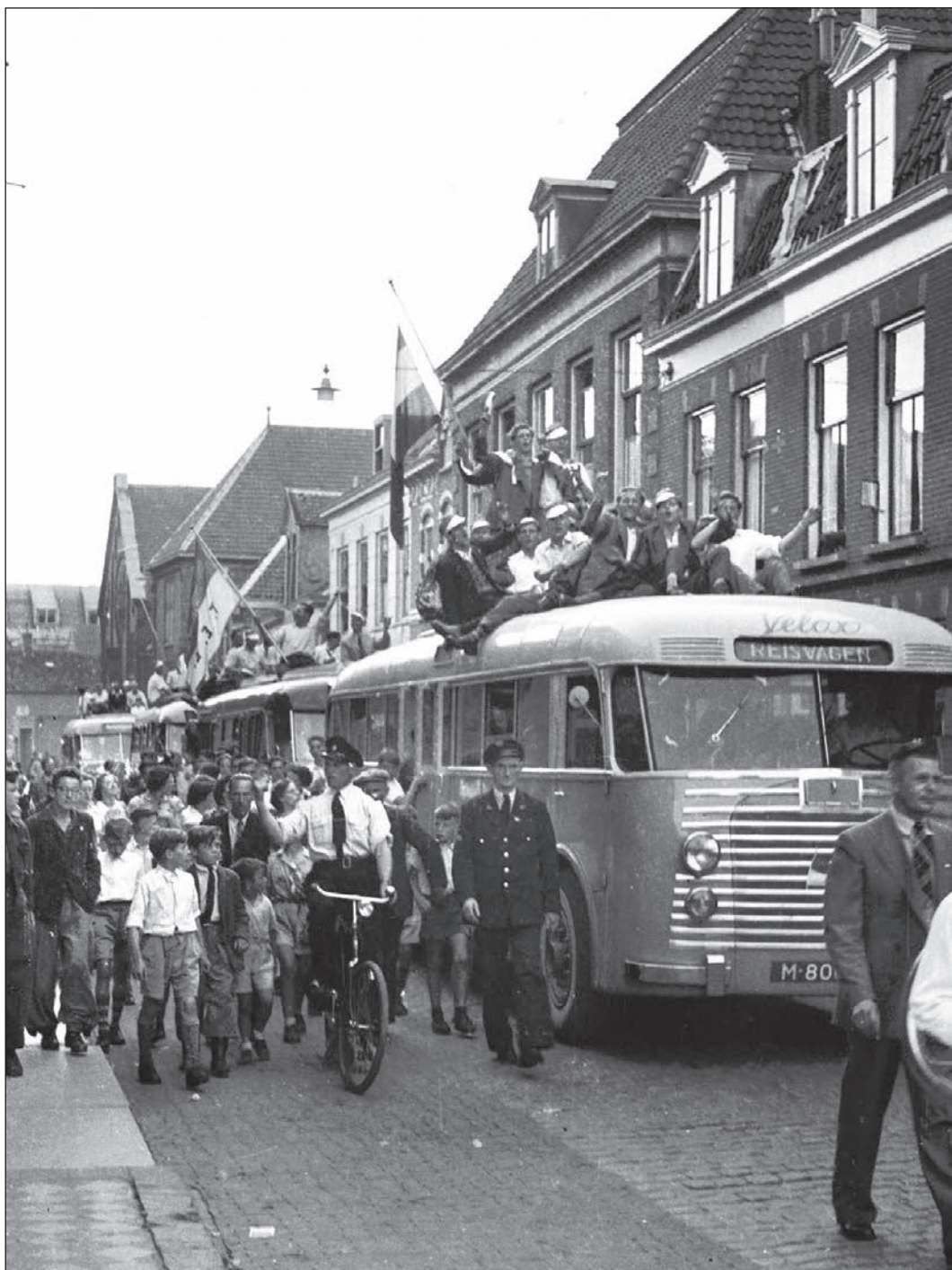
Intocht TEC-kampioenen in 1952.