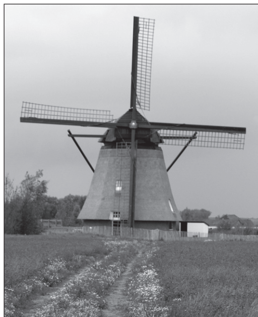
Pronkstuk op nieuwe locatie.

Bij het schrijven van dit artikel werd gebruikt gemaakt van eigen waarnemingen, diverse websites en informatiemateriaal van aannemersbedrijf Groot Roessink. De informatie over De Steendert is afkomstig van IVN gids Wil Miltenburg.