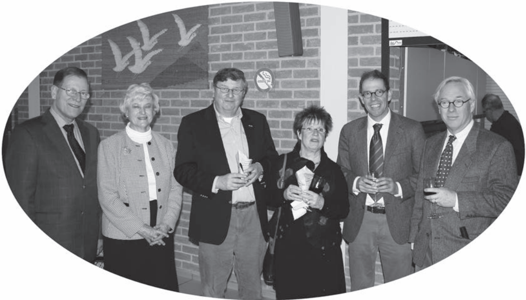
Het huidige bestuur (Dhr. W. Aalders ontbreekt op de foto).