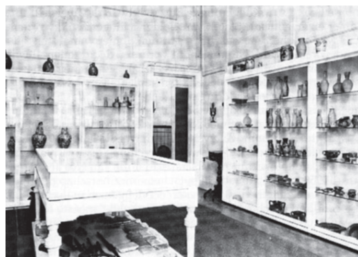
Kijkje in de Oudheidkamer aan de Agnietenstraat.