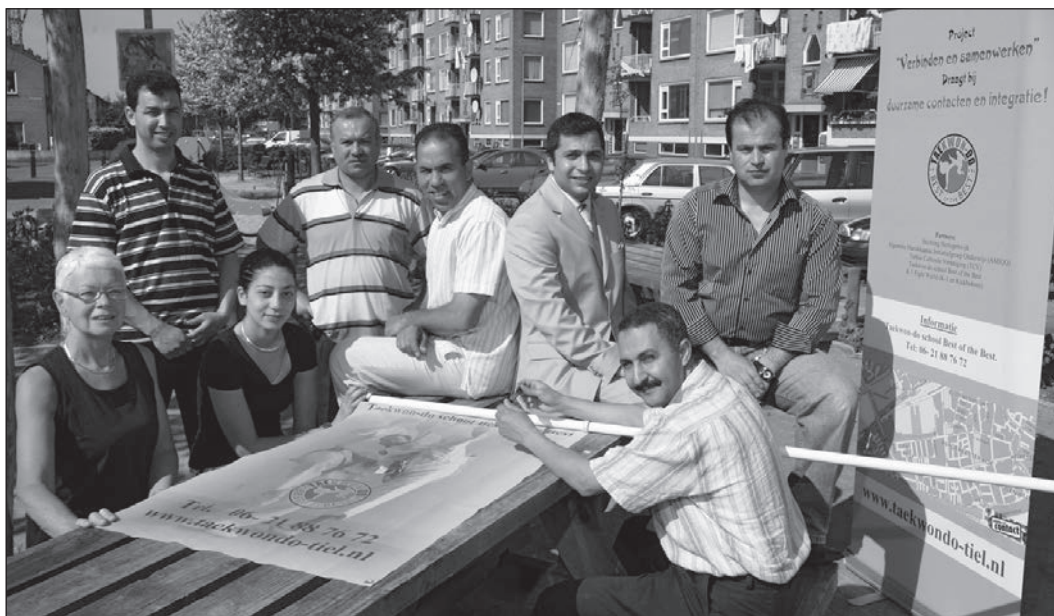
Projectgroep Tiel-West in overleg in de Hertogenwijk.