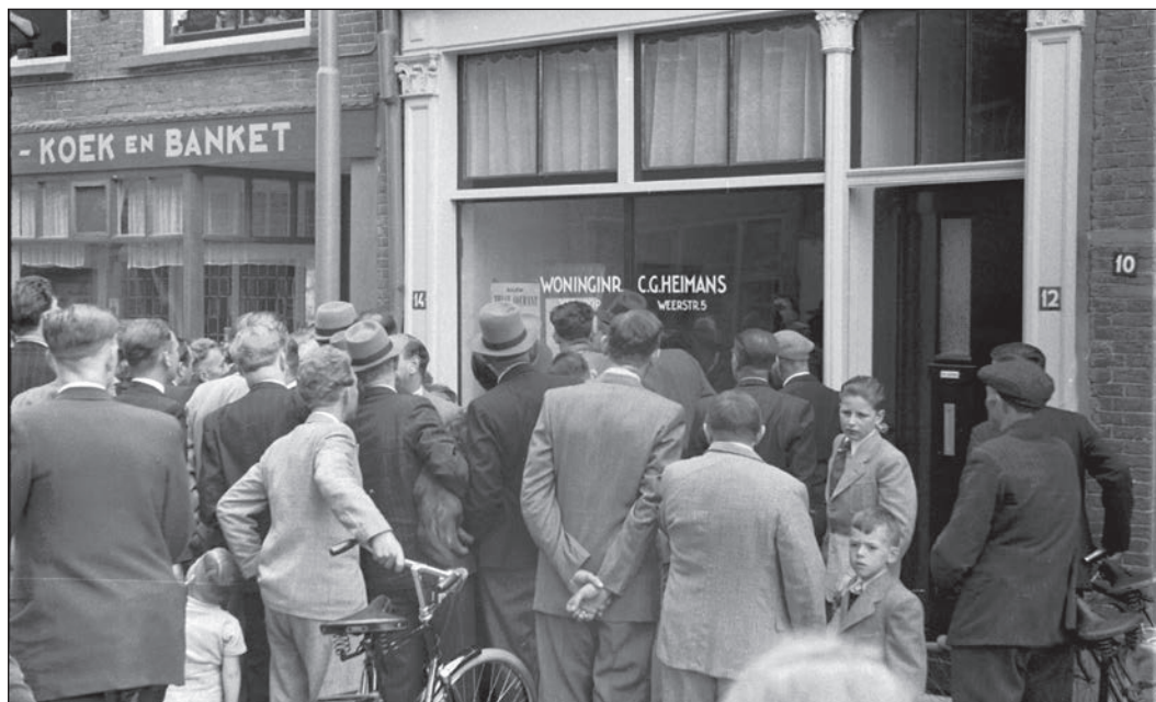
Op zondagmiddag uitslagen kijken op het Plein.

In de promotie-degradatie competitie won TEC twee keer van PEC Zwolle en thuis van Vitesse.