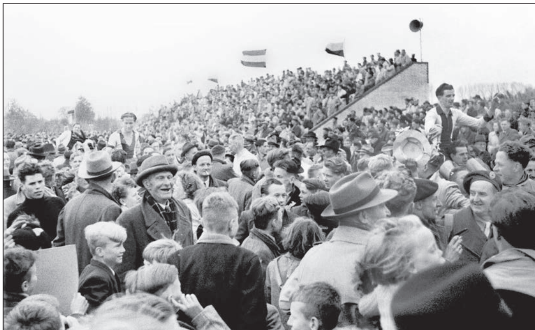
Een belangrijke wedstrijd op het Theoleterrein in 1951.