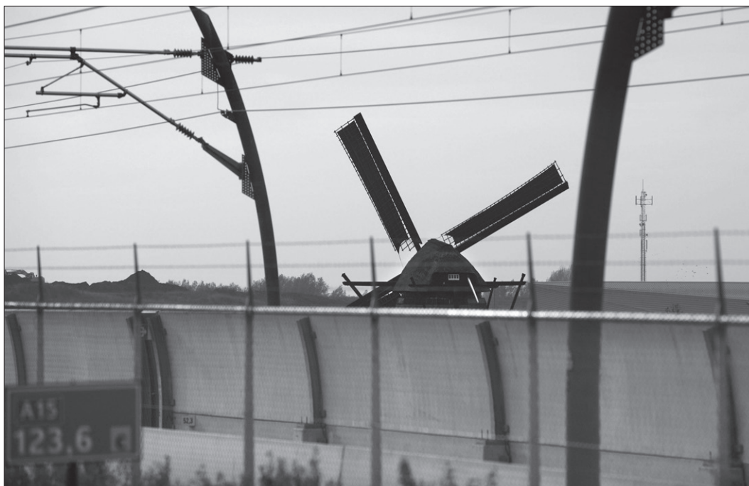
Door de aanleg van de Betuwelijn kwam de molen nóg meer in de verdrukking.

Wadenojen was tot 1953 de eigenaar. Door een fusie van waterschappen kwam de molen in 1953 in handen van het polderdistrict Tielervwaard. Vanaf 1974 werd de Molenstichting Gelders Rivierengebied de eigenaar en beheerder. Verplaatsing was noodzakelijk omdat de molen steeds meer ingesnoerd raakte tussen A15, de spoorlijn Geldermalsen-Arnhem, een lokale weg, de hoge vuilstortplaats van afvalverwijderaar AVRI en de Betuwelijn. De molen kreeg daardoor niet alleen te weinig wind maar raakte ook uit het zicht.