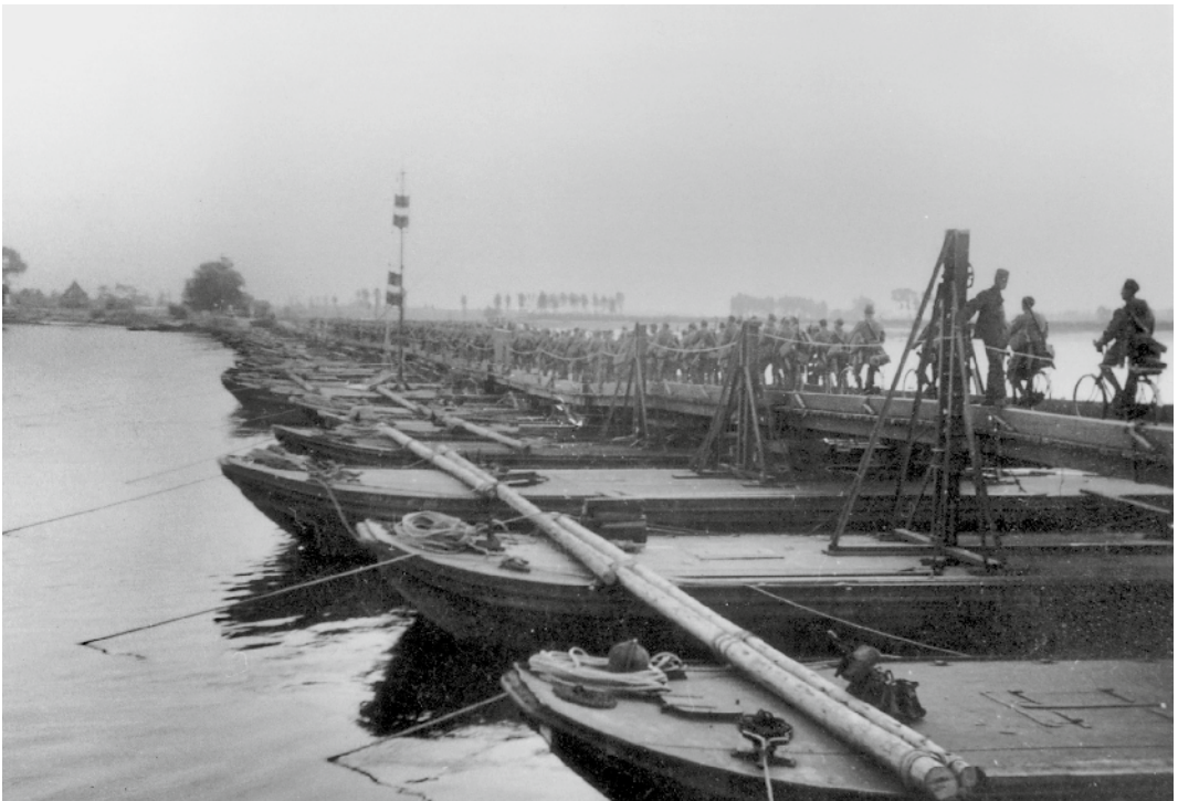
De pontonbrug waarover gemobiliseerde militairen begin september in Tiel de Waal over staken

gaan slapen. De paarden waren de laatste om half vier binnen, drijf en drijfnat en moesten ook nog overal ondergebracht worden. Sommige waren gewoon aan hekken vast gebonden. Over de Waal was een pontonbrug geslagen een geweldig breed water. Met de paarden gaf dit nogal moeilijkheden, trouwens ze hebben de paarden bijna allemaal, heel de weg, aan de kop moeten leiden. Ik heb geboft dat ik bij de staf ben want wij liggen in het voor Druten (een klein plaatsje) mooiste gebouw n.l. het patronaatsgebouw. De staf ligt altijd in het beste gebouw en de rest in de omgeving zoals in schuren enz. De keukenwagens waren op auto's zo vlug mogelijk naar de plaats gestuurd, om nog eten klaar te maken,