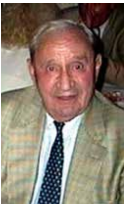
Hauptmann Martin Richter in 2002

in aanzienlijke mate de functie van de dijk als waterkering tijdens hoog water. De Duitsers wordt door Rijkswaterstaat aan het verstand gebracht dat ze dit beter niet kunnen doen als ze, tijdens hoog water, nog droge voeten willen houden áchter de dijk. De opstellingen worden snel weer dichtgegooid als het water in het najaar van 1944 begint te stijgen. Het personeel van de posten wordt geleverd in gevorderde boerderijen. Soms zijn de bewoners nog aanwezig, in andere gevallen wordt hen simpelweg aangezegd te vertrekken. Om maximaal effect van de beschikbare wapens te krijgen, worden de zware mitrailleurs en 81 mm mortieren waarover Richter beschikt, op strategische punten tussen de posten gepositioneerd. In deze setting is het bataljon gereed voor actie. Richter laat er geen gras over groeien en zendt al op 23 september 1944, de dag dat zijn troepen in Tiel arriveren, een patrouille naar de zuidelijke oever. Een week later, op 30 september 1944, maakt de bevolking van Wamel kennis met de Rusland variant van het omgaan met burgers door het Festungs MG