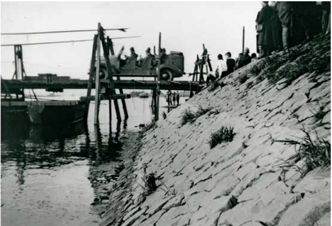
De pontonbrug waarover gemobiliseerde militairen begin september in Tiel de Waal over staken

met daglicht, de gehele bevolking was uitgelopen en de belangstelling was dan ook enorm, want niet alleen moesten wij passeren, maar er waren den gehele dag al grote t-groepenverplaatsingen geweest. Wij moesten dan ook op een hogen dijk (zoals je alleen hier ziet), de kanonnen passeerden, allemaal met gevorderde paarden, welke steeds schrokken voor onze fietslantaarns en allemaal in het donker. Het leek precies oorlog, dan heeft nog alles in de nacht plaats. Wij op de fiets gingen vooruit om te kijken waar we gelegerd waren. De burgemeester had pas 's-middags bericht gekregen en had in allerijl maatregelen moeten nemen om schuren en enige gebouwen in te richten, toen we daar om kwart voor twaalf aankwa-