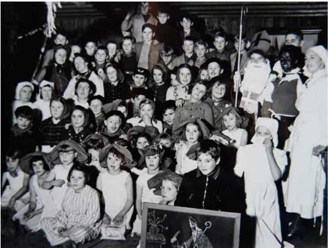
Groepsfoto van de Sinterklaasviering voor o.a. de Betuwse kinderen in Zweden in de plaats Tingsryd of Bolmen, december 1945

bleem, maar uiteindelijk blijkt dat meer voor de ouders dan voor de kinderen op te gaan. Die wennen snel aan de taal en hebben zelfs na zoveel maanden verblijf in Zweden, problemen met het Nederlands. De pleegouders willen ook de ouders thuis door middel van brieven op de hoogte houden en zelfs de brieven van de kinderen worden steeds vaker in het Zweeds geschreven omdat ze dat makkelijker vonden. Om ouders thuis te helpen biedt daarom de Tielse organisatie Nederlands Volksherstel aan, Zweedse of Nederlandse brieven in het Nederlands, cq. Zweeds te vertalen.