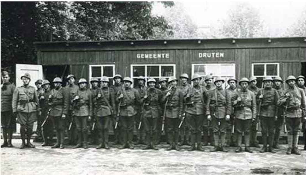
Een groep gemobiliseerde militairen in 1939 in Druten

"Het drama krijgt in de ochtend van 13 mei zijn ontknoping. Op de noordhelling van de Grebbeberg worden 4 Nederlandse bataljons (o.a. II-24-R.I.) vanuit Achterberg de Greb opgejaagd en ondernemen een laatste wanhoopspoging het Duitse tij te keren. Het blijkt een illusie. Met de komst van 27 Duitse Stuka-duikbommenwerpers is het einde daar. De strijd om de Grebbeberg is gestreden en betekent het einde van 380 Nederlanders, Pa heeft maar enkele uren op de Grebbeberg doorgebracht, maar dit waren wel de méést verschrikkelijke uren, terwijl andere terugtrokken (deserteerden?) werd 24-R.I. ingezet voor de tegenaanval."