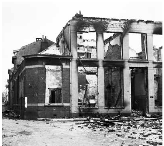
Het gebombardeerde woonhuis op de hoek van de Prinses Beatrixlaan en de Nieuweweg waar de familie Kocken in de kelder een veilig onderkomen had gezocht