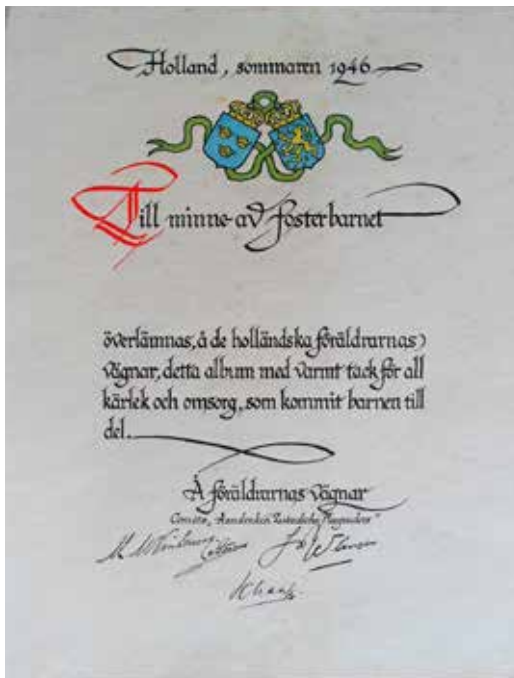
Gedrukte oorkonde van het Comité Aandenken Pleegouders, dat de kinderen aan de Zweedsche pleegouders konden schenken

Kinderuitzending is altijd een ingrijpend gebeuren voor alle betrokken partijen. Het is echter ook uit lokaalhistorisch oogpunt een belangrijk fenomeen. Want na de Eerste en Tweede Wereldoorlog waren er ook kinderuitzendingen, maar dan naar ons land toe. Van de Tielse afdeling van Nederlands Volksherstel is helaas tot op heden geen archief gevonden. Het archief van de Lutherse kerk bevat geen gegevens hierover en in de kranten wordt er nagenoeg niets inhoudelijks over vermeld. Wel is in het Nationale Rode Kruis archief, het Nationaal Archief in Den Haag en het archief van Rädde Barnen in