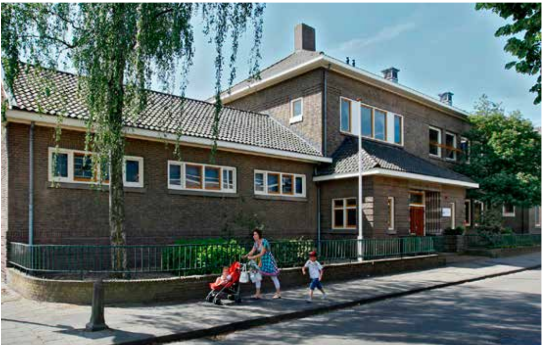
Hoofdingang van de inmiddels afgebroken Chr. Julianaschool, later Prins Willem Alexanderschool, aan de Grotebrugsegrintweg in 2002