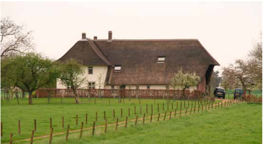
Boerderij de Oosterwaard aan de Eng in Kapel-Avezaath

Het ongeluk bleek nagenoeg verdwenen uit het geheugen van de dorpsbewoners, die het destijds van dichtbij hadden meegemaakt. Het viel Jan wel op dat vrijwel alle dorpsbewoners, die hij er over sprak, geen haat koesterden tegen de omgekomen bemanningsleden. “Het waren gewone jongens” en “Ze werden ook maar gestuurd”, hoorde hij nog-