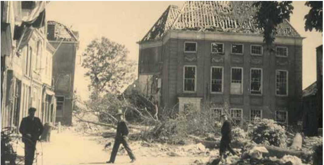
De Waterpoort is opgeblazen op 15 november 1944

Deze Russische krijgsgevangenen droegen gedwongen een Duits uniform en hadden ook een geweer. Achteraf bleek dat bij weigeren ze gefusilleerd werden. Dit optreden van de Russen is onbekend gebleven bij verschillende geschiedenisschrijvers over Tiel.