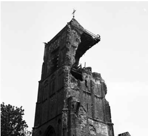
De kapotgeschoten Sint Maartenstoren. Later stortte het dak in en bleef alleen de torenstomp staan.

Toen het schieten rustig werd, zijn we via de stenen keldertrap over het puin naar boven gekropen. Hier bleek dat het hele huis in puin lag. Dit was het moment dat we moesten evacueren. Van ons gezin ging een deel naar Buren, een deel naar Kerk-Avezaath. De oudste jongens bleven nog in Tiel, hoe gevaarlijk ook,