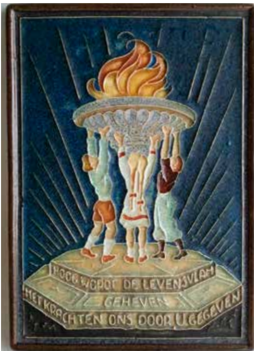
Polychrome herdenkingstegel, vervaardigd door De Porceleyne Fles in 1946, naar ontwerp van H.J. Tieman. Uitgegeven ter herinnering aan de uitzending naar Zweden. De tekst luidt: 'Hoog wordt de levensvlam geheven, met krachten ons door u gegeven.' (Particuliere collectie)