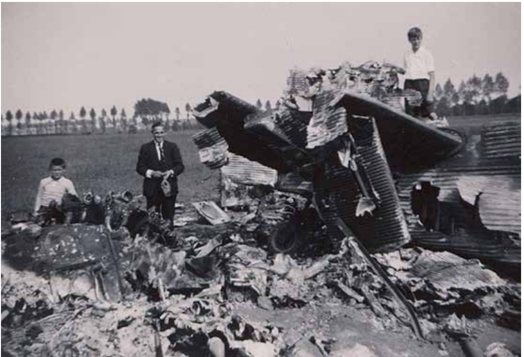
Er bleef weinig over van het neergestorte toestel

Jan Vermeulen verzamelde deze en nog veel meer gedetailleerde informatie via gesprekken met ooggetuigen, documenten uit het archief van de gemeente Zoelen en de notulen van de dorpspolder Kapel- en Kerk-Avezaath. De auteur zocht ook uit welke Nederlandse legeronderdelen toen in Tiel en wijde omgeving gestationeerd waren en hoe de (lucht)verdediging was opgebouwd en feitelijk functioneerde. Meerdere onderdelen claimden dat zij, voordat het toestel een noodlanding maakte, het met een voltreffer tot landen gedwongen hadden. Ook het Duitse aanvalsplan wordt nauwkeurig omschreven. Jan Vermeulen constateert dat veel Duitse soldaten veel minder ervaren waren dan vaak aangenomen wordt. Hij ontdekte ook dat