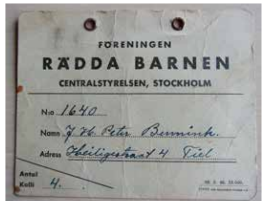
Kartonnen label voor Peter Bennink, dat bij de uitzending permanent om de hals gedragen moest worden

“Einde september werden we met de trein naar Utrecht gebracht. Op het Paardenveld werden we in grote visvrachtauto's (motorwagen met oplegger) geladen, we kregen een paar dekens en onderweg Duits brood en drinken. Een grote deur in de oplegger bleef open, wel was er een hek voor de opening.