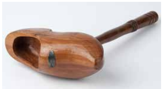
Houten voorzittershamer in de vorm van een klomp (Collectie: Flijpe en Streekmuseum Tiel)

in de buurt overleed, zoals van oudsher gebruikelijk, te begraven. Het 'Reglement voor de buurten der stad Tiel' uit 1829 spreekt van de vier naaste buren als baadragers. Wie zich aan deze verplichting onttrok of geen remplaçant stuurde, betaalde een boete van negentig cent. Ook hief men een contributie (in 1835 tien cent per maand; 1892 vijftig cent per drie maanden), terwijl de Balije van Utrecht jaarlijks vijf gulden voor de teeravond bijdroeg. Twee loot- of buurtmeesters waren verantwoordelijk voor het geldelijk beheer en verder dienden zij ieder half jaar mutaties in de samenstelling van de bewoners ter stadssecretarie door te geven. De laatste reglementen van buurt De Klomp, opgemaakt in 1884, geven nog wat aardige details: 'De buren zijn verplicht ter begrafenis te verschijnen in zwarte kleding met witte das. Die hieraan niet voldoet, betaalt eene boete van 25 cents. Het gebruik van een overjas is geoorloofd'. Bij koperen en zilveren bruiloften gaven de buurtgenoten elkaar geschenken.