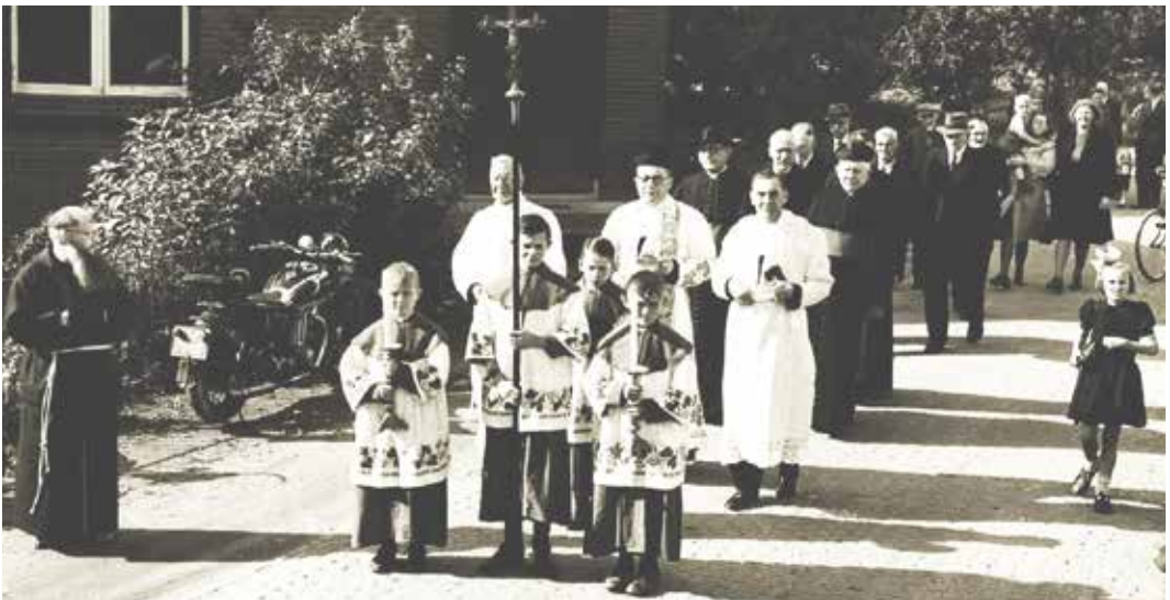
Op weg van oude kerk aan de Kerkweg naar de eerste steenlegging, 14 juli 1948

Het halve dorp liep uit. Van de andere helft van het voornamelijk protestantse dorp had een deel (lichte) weerzin tegen dit Roomse vlagvertoon.