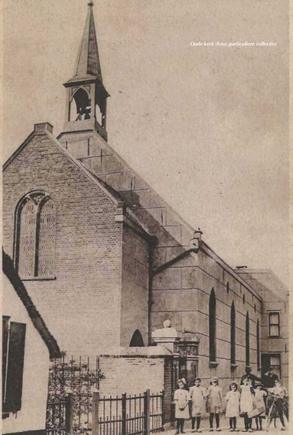
Oude kerk