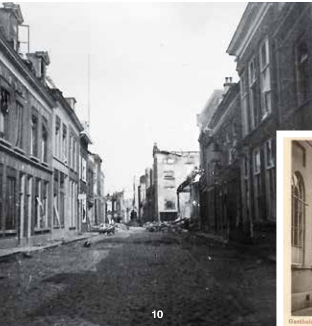
Foto 10 De Gasthuisstraat. Deze straat was minder getroffen dan bijvoorbeeld de Waterstraat. Alleen de huizen in de verte, waar ook het oude stadhuis lag, zijn onherstelbaar verwoest.