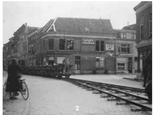
Foto 2 Deze foto is veel later gemaakt dan de rest van de serie (met uitzondering van nummer 14 en 15). De opname toont de smalspoorlijn (de 'puinexpres'), die het puin uit de binnenstad via de Voorstad (hier op de foto) afvoerde naar de Oude Haven.