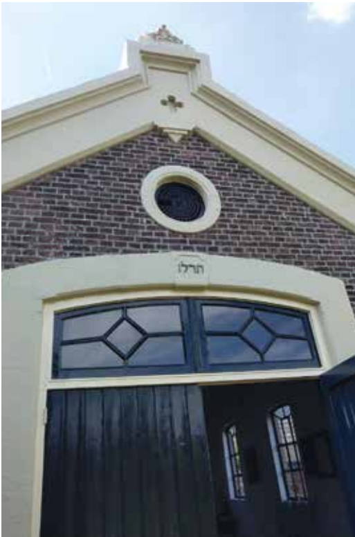
De nok van het Metaheirhuisje

Op de website van de Vereniging Oudheidkamer staat de lange lijst met namen van de Tielenaars die de oorlog niet hebben overleefd. De lijst wordt echter aanzienlijk langer als wordt uitgegaan van hen die in Tiel waren geboren maar korter of langer daarna vanuit Tiel, vaak om den brode, naar (meestal) de grote steden in het westen van ons