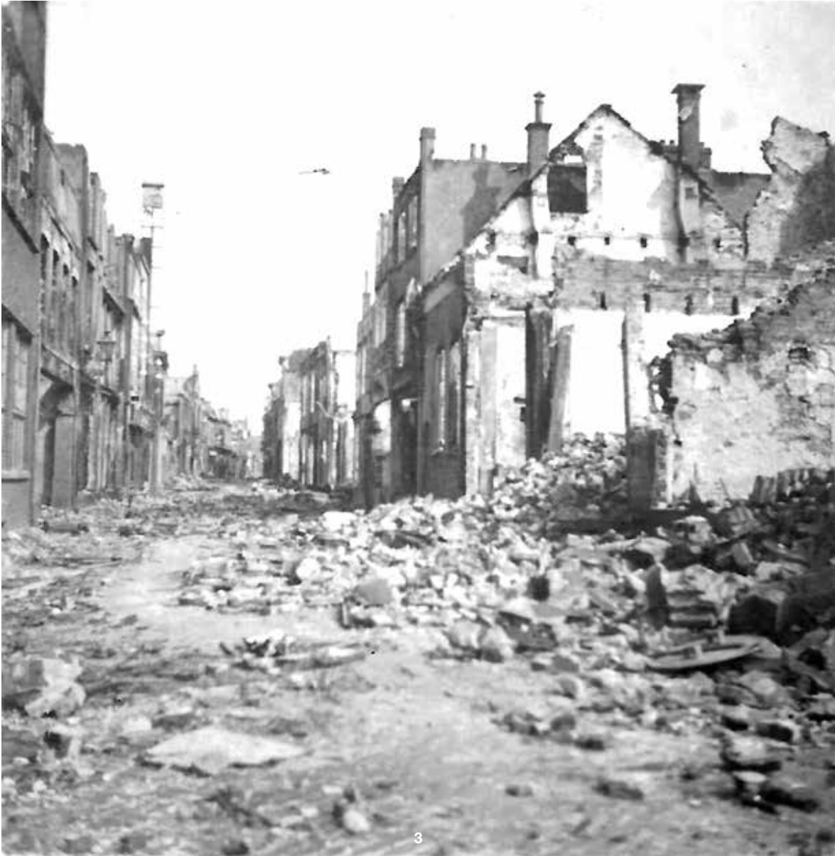
Foto 3 De Waterstraat in 1945.

De foto is gemaakt aan het begin van de straat in de richting van de Groenmarkt.