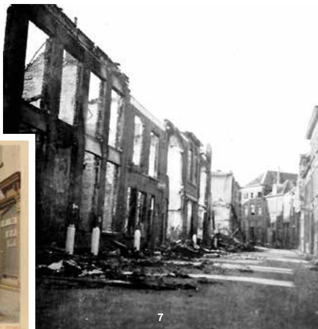
Foto 7 De Westluidensestraat in de richting van de binnenstad. Van de huizen links is niets over. De huizenrij rechts lijkt het oorlogsgeweld redelijk te hebben doorstaan. Even voorbij het laatst zichtbare huis rechts was er echter zoveel verwoest, dat er in 1954 een doorbraak naar de Groenmarkt werd gerealiseerd, de Damstraat.