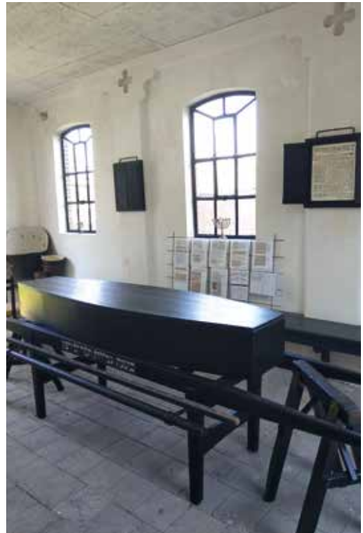
Kist, op de achttiende eeuwse bar, voor de rituele reiniging

Ook zijn de banken door vrijwilligers weer in de oorspronkelijke grijze tint teruggebracht en zijn de muren gesaust. De afronding vormt de verdere inrichting en uitbreiding van de expositie over o.a. het joodse leven in Tiel, de 'Stolpersteine' en achtergronden van tal van Joodse inwoners. Mede dankzij verschillende bruiklenen kan nu ook een aantal oude voorwerpen en boeken worden getoond.