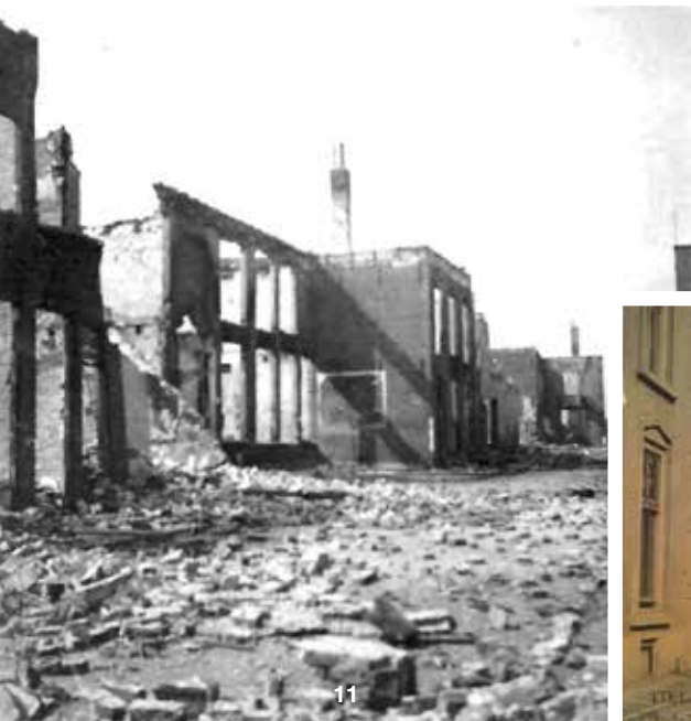
Foto 11 Het Hoogeinde. Met de rug naar de huizen van de Sint-Walburgstraat fotografeerde Koos Vos in de richting van de gracht. Links de verwoeste panden, waar later het postkantoor kwam. De villa achter de boom rechts lag aan de Konijnenwal.