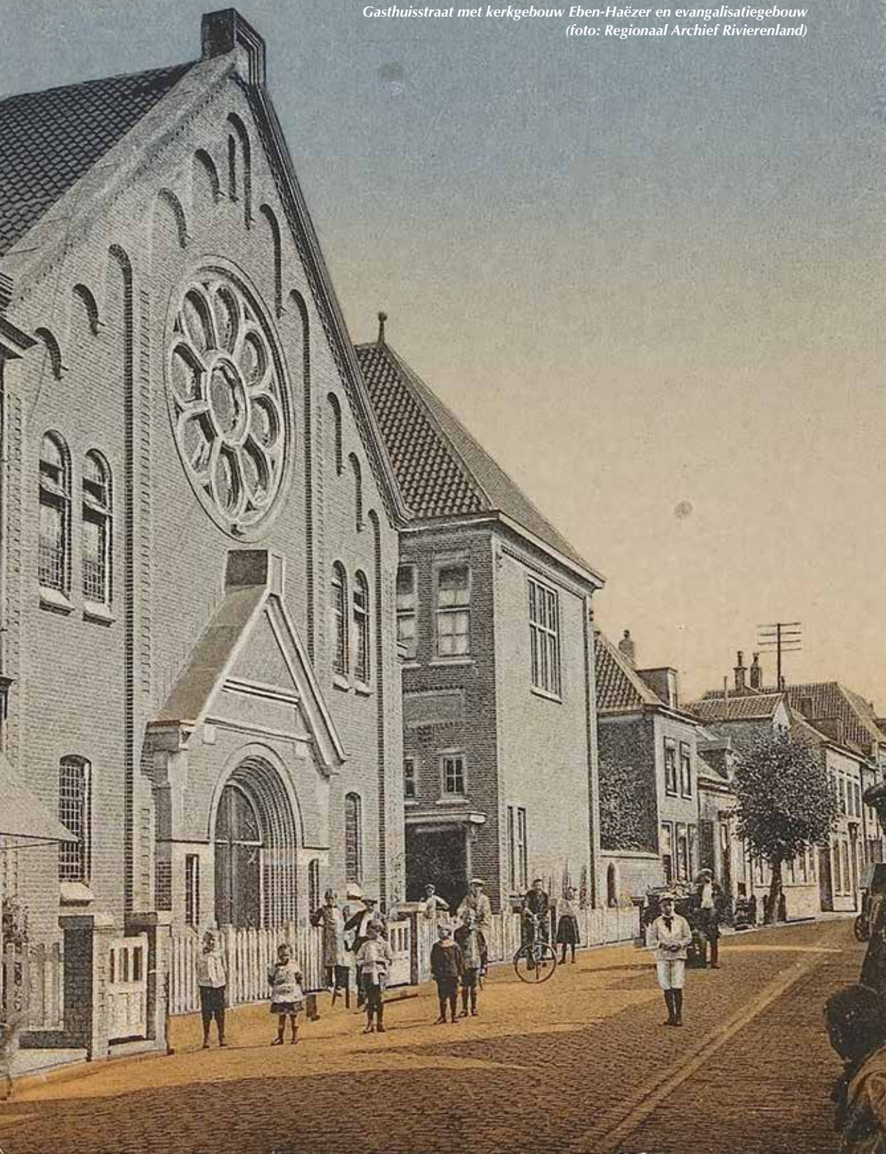
Gasthuisstraat met kerkgebouw Eben-Haëzer en evangelisatiegebouw