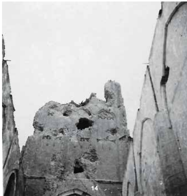
Foto 14 Bijna dezelfde invalshoek als op de vorige foto, maar enige weken later. De torenspits is verdwenen en er bleef een kale stomp over. Pas in 1964 zou de toren worden herbouwd.