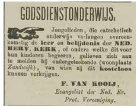
Nieuwe Tielsche Courant 1 okt. 1887

Ook de reactie van H.W.S. was duidelijk. Ze schreef: "Ik verzoek u derhalve ons geen quitantiën meer te doen aanbieden voor de Ned. Ev. Prot. Vereeniging." 9