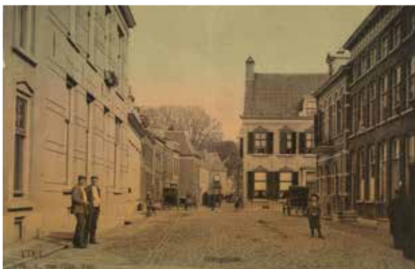
Foto 12 De Kerkstraat vanaf de Waterstraat. Het pand op de hoek rechts is het nog bestaande hoekhuis Waterstraat-Kerkstraat. Op de plaats van de verwoeste huizen links is na de sloop ruimte gemaakt voor de verbreding van de Waterstraat.