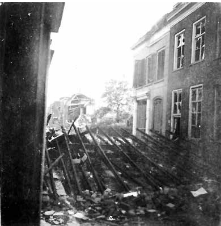
Foto 6 Een tankversperring in de Westluidensestraat. De foto is gemaakt vlak voor het voormalige woonhuis van de Tielse rabbijn. Het huis in het midden, op de hoek van de straat was een slagerij. Nu is daar een ijssalon gevestigd. De Duitsers vreesden kennelijk in november 1944 na de geallieerde verovering van West-Brabant een aanval van de Britse troepen. Zij hebben in die periode de binnenstad van Tiel in staat van verdediging gebracht door het aanleggen van loopgraven, het maken van barricades en dit soort tankversperringen.