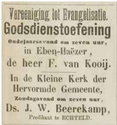
Nieuwe Tielsche Courant 31 dec. 1892