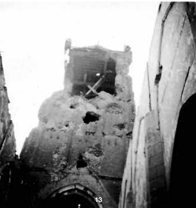
Foto 13 De Sint-Maartenstoren vanuit de verwoeste kerk. Koos Vos koos hier een unieke hoek. Staande in de kerk fotografeerde zij naar boven recht in het gapende gat dat de toren vertoonde. Bij een flinke storm op 14 mei 1945 stortte de spits definitief in.