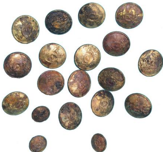
Afbeelding 2: Uniformknopen van de post- en telegraaf besteller. Datering 1897-1928. Twee verschillende maten in knopen zijn aangetroffen. Foto niet op schaal.

Vermeldenswaardig is dat een grote hoeveelheid vroeg 20 ste eeuwse knopen in het noordelijk deel van de gracht is aangetroffen. Opvallend is dat deze knopen dezelfde afbeelding dragen. Deze afbeelding bestaat uit een posthoorn en een tweetal kruislinks aangebrachte bliksemschichten.