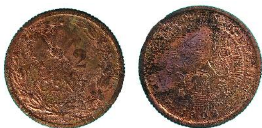
Afbeelding 7: ½ cent geslagen in 1903. Foto schaal 2:1.

Het Koninkrijksgeld is afkomstig uit het Noordelijk deel van de gracht. Ze kunnen gedateerd worden in de periode 1878-1982. Het zijn de gebruikelijke centen, stuivers en een enkel dubbeltje en kwartje. Daarnaast is een 10 Eurocent stuk gevonden. Omdat deze munten vanaf 2002 werden gebruikt maar al in 1999 voor het eerst werden geslagen, zal deze munt tussen 2002 en het jaar van de baggerwerkzaamheden, 2007, in de stadsgracht zijn verloren.