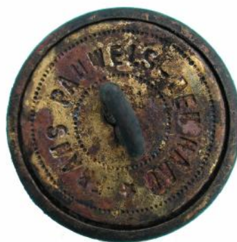
Afbeelding 6: Uniformknoop met tekst FRANS PAUWELS DEN HAAG. Foto schaal 2:1.