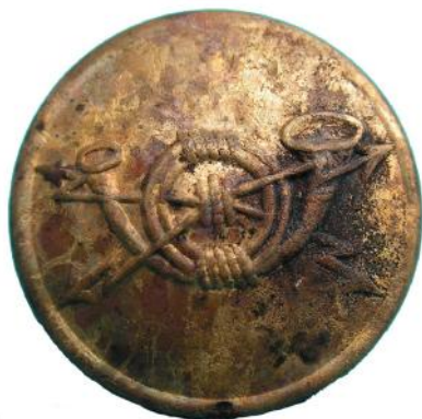
Afbeelding 3: Uniformknoop met de afbeelding van een posthoorn en een tweetal bliksemschichten. Datering 1897-1928. Foto schaal 2:1.

Uniformknopen voorzien van een posthoorn en een tweetal bliksemschichten worden in verband gebracht met de bestellers van de post- en de telegraafkantoren en kunnen grofweg in het eerste kwart van de 20 ste eeuw gedateerd worden.