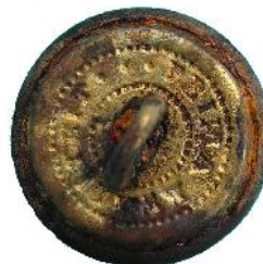
Afbeelding 4: Klein type uniformknoop (diameter 15 mm) met tekst "PRIMA KWALITEIT". Foto schaal 2:1.

De knopen komen in twee verschillende maten voor. Het meest frequent zijn de grote knopen met een diameter van 22 mm aangetroffen. De kleine en minder frequent aangetroffen knopen hebben een diameter van 15 mm.