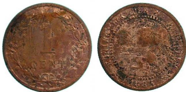
Afbeelding 8: 1 cent geslagen in 1884. Foto schaal 2:1.

Via de gemeente Tiel zijn een drietal halfjes aangeleverd. Deze halfjes zijn dusdanig versleten dat het jaartal waarop de munt is geslagen, niet meer achterhaalbaar is. Vanwege dezelfde reden zijn de voorwerpen ook niet in de catalogus afgebeeld.