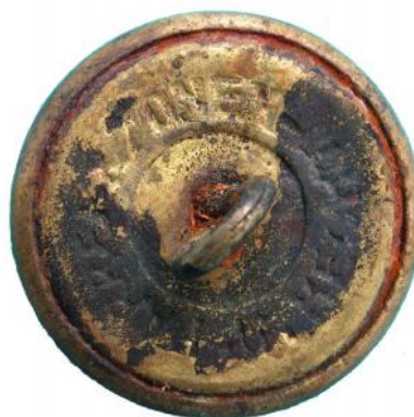
Afbeelding 5: Uniformknoop met tekst PARREE & ZONEN, UTRECHT. Foto schaal 2:1.

Interessant zijn de teksten die op de achterzijde van deze knopen van bestellers van post- en telegraafkantoren zijn aangebracht. Vier verschillende teksten konden onderscheiden worden. Zij varieerden van "EXTRA FEIN" en "PRIMA KWALITEIT" tot namen van de leverancier van de knopen of de producent van de uniformen.