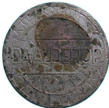
Afbeelding 10: Kantinepenning van de Tielse firma Daalderop. Datering circa 1970. Foto schaal 2:1.

Twee penningen zijn tijdens de archeologische begeleiding aangetroffen. Het is een zogenaamde kantinepenning van de Tielse firma Daalderop en een speelpenning van de Fa. Castricum uit Krommenie. Beide penningen kunnen rondom 1970 gedateerd worden.