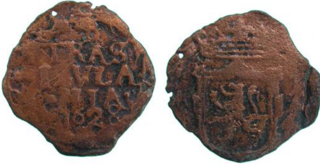
Afbeelding 9: Duit van Overijssel gedateerd 1628. Foto schaal 2:1.

In het totaal zijn tenminste negen duiten in het Noordelijk deel van de gracht aangetroffen. De determineerbare duiten zijn afkomstig uit Gelderland, Overijssel, Utrecht en Zeeland. Op één uitzondering na kunnen de duiten in de 18 de eeuw gedateerd worden.