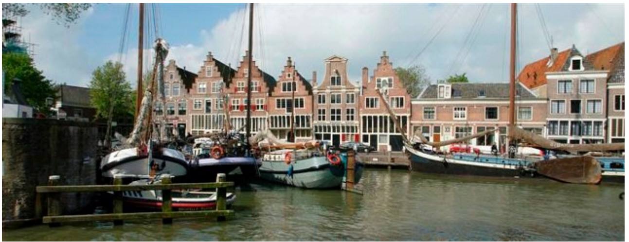
Hoorn, Veermanskade